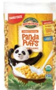
Panda Puffs Cont. Net.: 700g