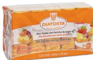
Regular Cont. Net.: 240g