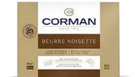
Roasted Butter Sheet 82 % Fat Cont. Net.: 2kg