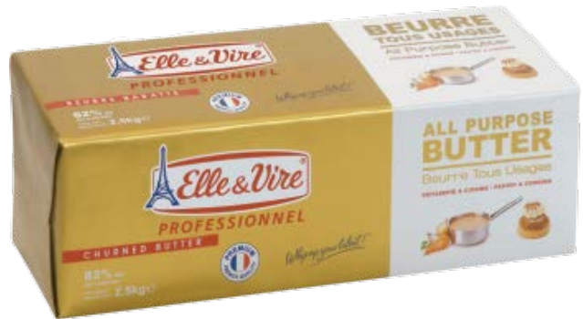
Mantequilla All-Purpose 82% Fat Cont. Net.: 2.5 kg