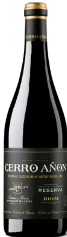
CERRO AÑON RESERVA D.O.: RIOJA Cont. Net.: 750 ml