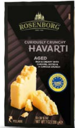
Queso Havarti Aged Cont. Net.: 227g