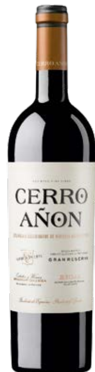
CERRO AÑON GRAN RESERVA D.O.: RIOJA Cont. Net.: 750 ml