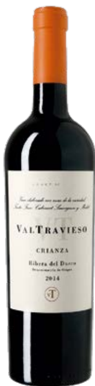
VALTRAVIESO CRIANZA D.O.: FIBRADEL DUERO Cont. Net.: 750 ml