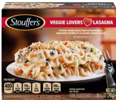
Lasaña De Vegetales