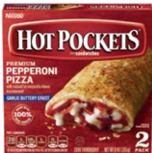
Pepperoni Pizza 2pack