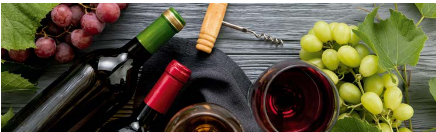
ÉBANO CRANZA SALVAJE D.O.: RIBERA DEL DUERO Cont. Net.: 750 ml