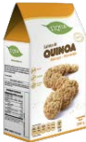
Quinoa Mango & Naranja Cont. Net.: 200g