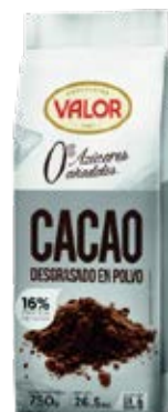
Cacao Desgrasado en Polvo (0% Azucres Anadidos) Cont. Net.: 750g