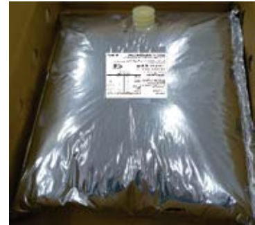
Cream Cheese Cont. Net.: 10 kg