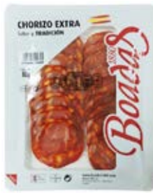
Chorizo Extra Cont. Net.: 80g