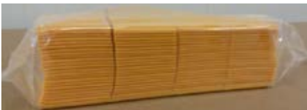
Queso Procesado Con Grasa Vegetal Sabor Cheddar 2.27 kg (160 slices)