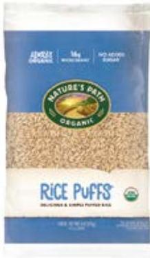
Rice Puffs Cont. Net.: 675g