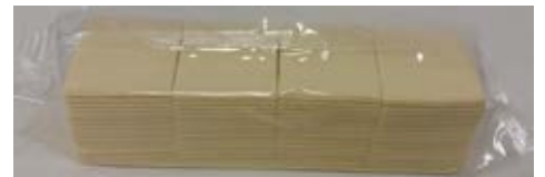
Queso Procesado Con Grasa Vegetal Sabor Emmental 2.27 kg (160 slices)