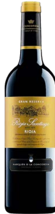
RIOJASANTIAGO GRAN RESERVA D.O: RIOJA Cont. Net.: 750 ml