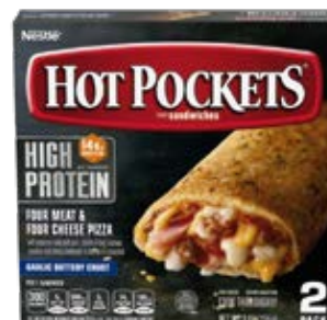
Cuatro Carnes Y Queso 2pack