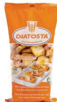
Regular Cont. Net.: 180g