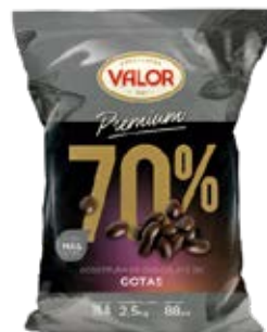
Cobertura de Chocolate en gotas (70%, 52%, Leche, y Blanco) Cont. Net.: 2.5 kg