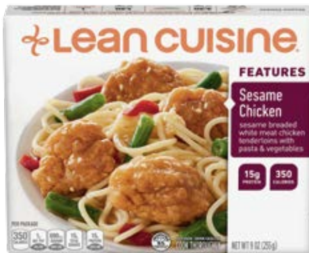
Trocitos De Pollo Al Ajonjolí Cont. Net.: 255g