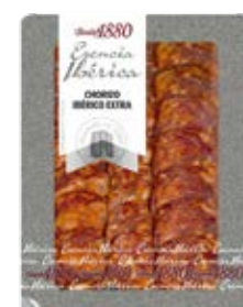
Chorizo Ibérico Extra Cont. Net.: 70g