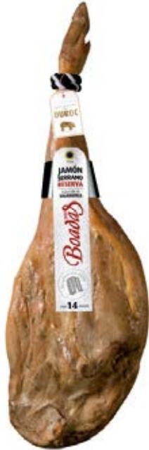
Jamón Serrano Reserva Cont. Net.: Peso Variable