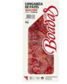
Longaniza de Payes Selección Cont. Net.: 80g