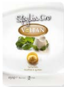
Ricotta y Espinacas