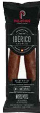
Chorizo Ibérico Cont. Net.: 200g