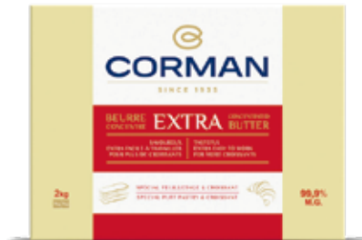
Extra concentrated butter 99.9 % Fat Croissant & Puff Pastries Cont. Net.: 2kg