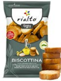
Redondas Aceite y Sal Cont. Net.: 100g