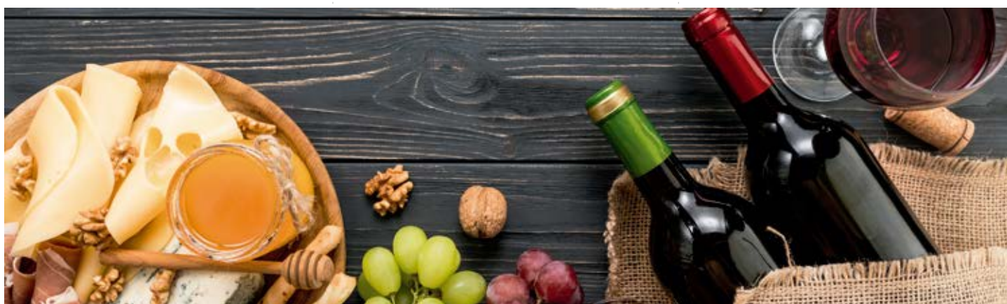
OTOÑAL RESERVA D.O.: RIOJA Cont. Net.: 750 ml