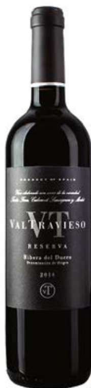
VINO VALTRAVIESO RESERVA D.O.: FIBRADEL DUERO Cont. Net.: 750 ml