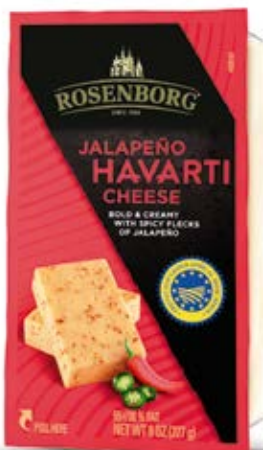
Queso Havarti Jalapeño Cont. Net.: 227g