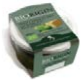
Pesto Cont. Net.: 120g