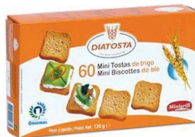
Regular Cont. Net.: 120