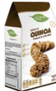
Quinoa Chispas de Chocolate Cont. Net.: 200g / 400g