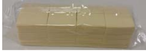
Queso Procesado Sabor Queso Blanco 2.27 kg (160 slices)