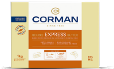
Express Butter 82 % Fat Croissant & Puff Pastries Cont. Net.: 1kg