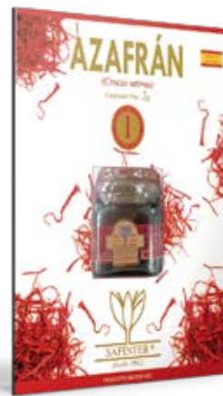
Azafrán Cont. Net.: 2 g /5g / 10g