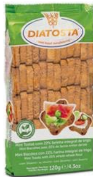
Regular Cont. Net.: 120