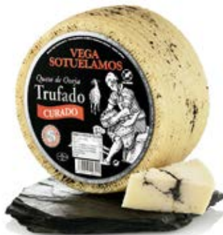
De Oveja Curado Con Trufa Cont. Net.: Variable