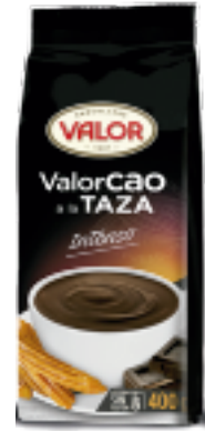
Valorcao a la Taza Intenso Cont. Net.: 400g