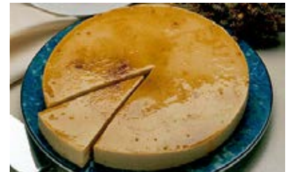
Tarta Gijonesa Cont. Net.: 1kg