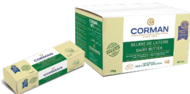
Margarina premium Cont. Net.: 2.5kg / 10kg