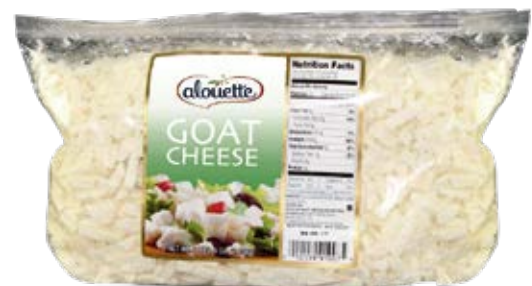
Queso de Cabra – Crumbles Cont. Net.: 4.5lb