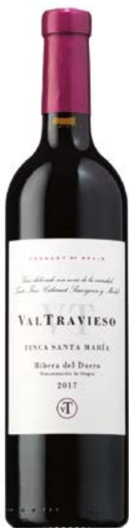
VALTRAVIESO NICASANTA MARÍA D.O.: FIBRADEL DUERO Cont. Net.: 750 ml

La gama VT de Valtravieso, a la que pertenece su Crianza, está elaborada mediante una selección de las mejores uvas procedentes de la Finca La Revilla lo que le proporciona al vino un equilibrio perfecto entre acidez, alcohol y taninos.