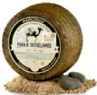
Manchego Curado Cont. Net.: 3.25 kg