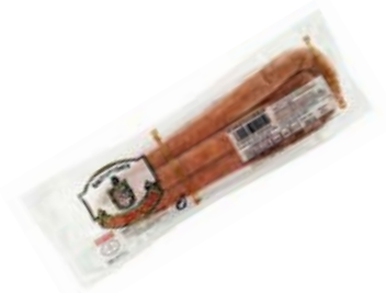
Chistorra Española Cont. Net.: 250g