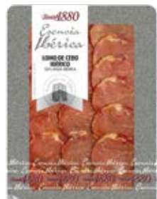
Lomo Ibérico De Cebo Cont. Net.: 70g