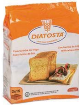
Regular Cont. Net.: 225g (2 x 112g).