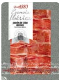
Jamón Ibérico De Cebo Cont. Net.: 70g