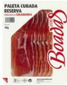
Paleta Curada Reserva Cont. Net.: 80g