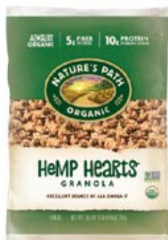
Hemp Hearts Cont. Net.: 750g