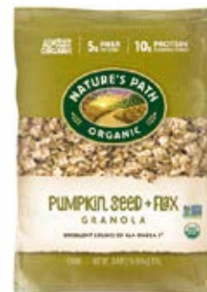
Pumpkin Seed Plus Cont. Net.: 750g