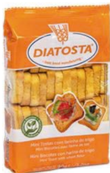
Regular Cont. Net.: 150g