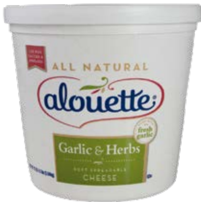
Crema de Ajo y Hierbas Cont. Net.: 4.5lb