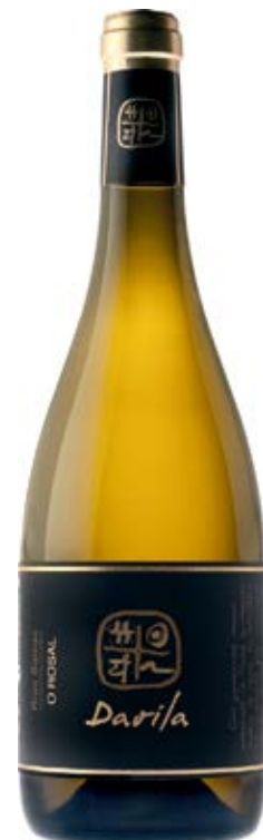
DAVILA D.O.: RÍAS BAIXAS Cont. Net.: 750 ml