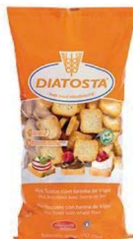
Regular Cont. Net.: 350g