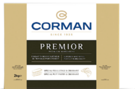
Premium Margarine Croissant & Puff Pastries 80 % Fat Cont. Net.: 2kg