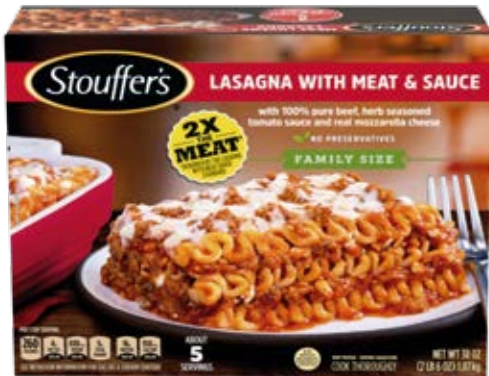
Lasaña Carne Y Salsa