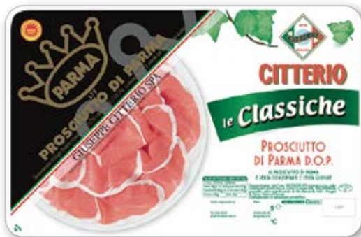
Prosciutto DiParma DOP Cont. Net.: 340g