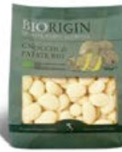
Gnocchi Cont. Net.: 500g