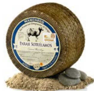
Manchego Añejo Cont. Net.: 3.15 kg