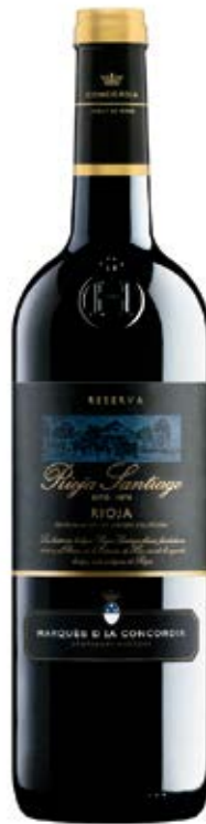
RIOJASANTIAGO RESERVA D.O: RIOJA Cont. Net.: 750 ml