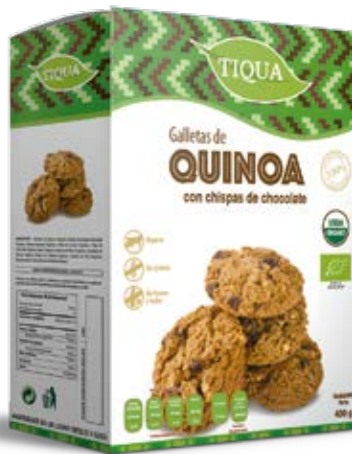
Quinoa Con Chispas de Chocolate Orgánicas Cont. Net.: 200g / 400g