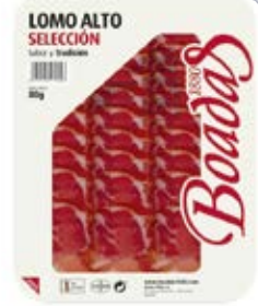
Lomo Alto Cont. Net.: 80g