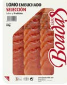
Lomo Embuchado Cont. Net.: 80g