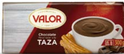
Tableta Chocolate a la Taza Cont. Net.: 300g