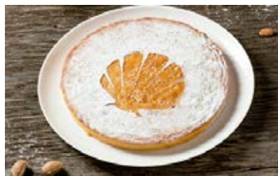
Tarta de Santiago Cont. Net.: 800g