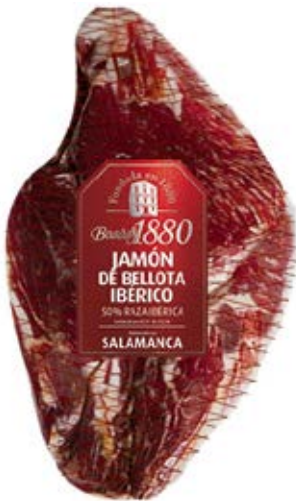
Jamón De Bellota Ibérico Cont. Net.: Peso Variable