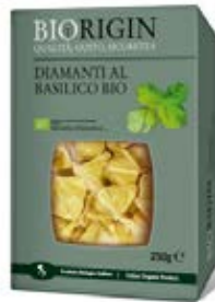
Albahaca diamanti Cont. Net.: 250g