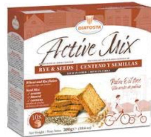
Active Mix – Centeno y Semillas Cont. Net.: 300g.