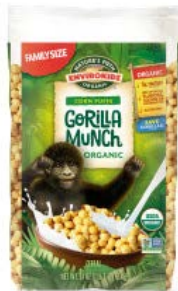
Gorilla Munch Cont. Net.: 650g