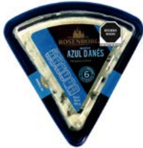
Queso Azul Cont. Net.: 100g