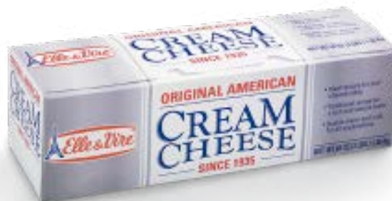
Cream Cheese 34% Fat Cont. Net.: 1.36 kg