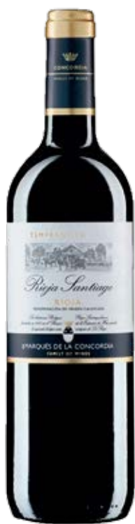
RIOJASANTIAGO TEMPRANILLO D.O: RIOJA Cont. Net.: 750 ml

Una de las empresas vinícolas más importantes a nivel mundial, MARQUÉS DE LA CONCORDIA ofrece unos productos de una calidad excelente. Gracias a su gran amplitud de terreno y las condiciones que les proporciona su ubicación geográfica tienen la posibilidad de experimentar con diferentes tipos de uva lo que les hace únicos. Fundada en 1870, Rioja Santiago es la segunda bodega más antigua de La Rioja y una de las 3 en todo el mundo acreditada para utilizar la palabra "Rioja" en su nombre. Sigue fiel a su filosofía de hace más de 100 años lo que le permite producir vinos Rioja de la más alta calidad.