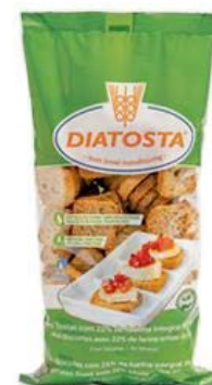
Regular Cont. Net.: 180g