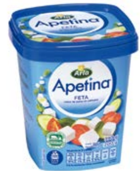
Queso Apetina Feta En Salmuera Cont. Net.: 430g