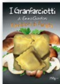
Mushroom Ravioloni Cont. Net.: 250g