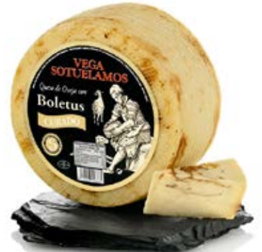
De Oveja Con Boletus Cont. Net.: variable