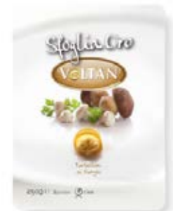
Tortelloni con Champinones