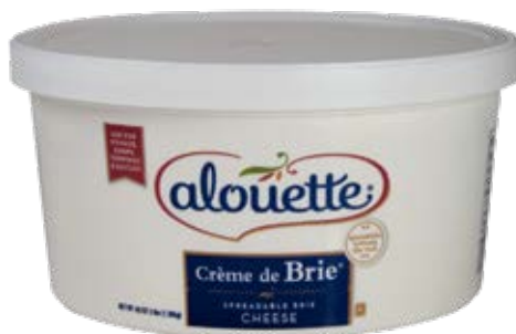
Crema de Brie Cont. Net.: 40lb