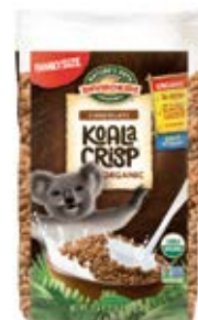
Koala Crisp Cont. Net.: 725g