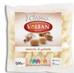
Gnocchi de patata