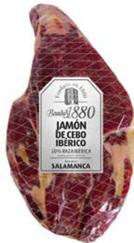
Jamón De Cebo Ibérico Cont. Net.: Peso Variable