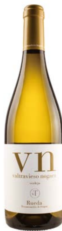
VALTRAVIESO NOGARA VERDEJO D.O.: RUEDA Cont. Net.: 750 ml