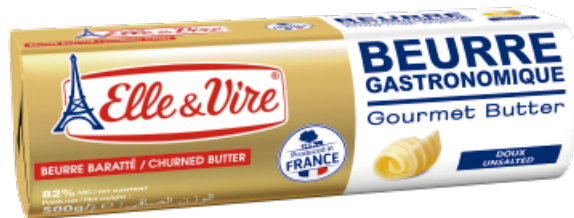
Roll Mantequilla Gourmet 82% Fat Cont. Net.: 500g