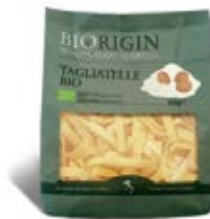
Tallarines Cont. Net.: 250g