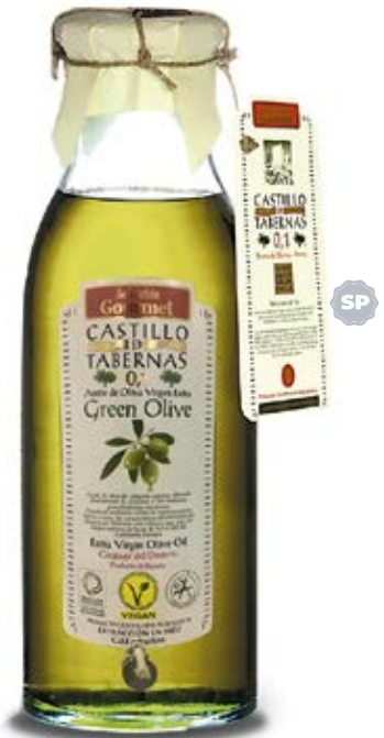
Acéte de Oliva- Green OliveMagnum Cont. Net.: 5 lt