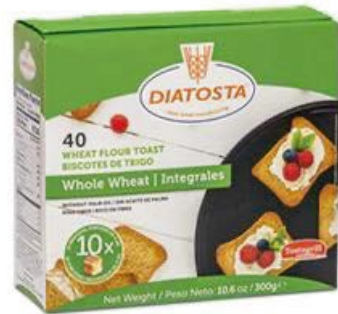
Integral Cont. Net.: 300g.