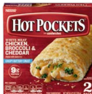
Pollo, Brocoli Y Cheddar 2 pack