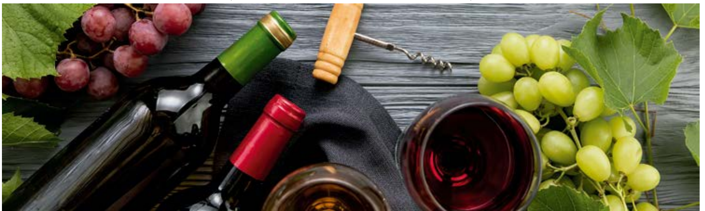
AÑARES BLANCO D.O: RIOJA Cont. Net.: 750 ml