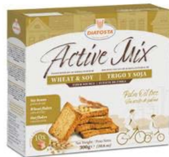
Active Mix – Integral y Soja Cont. Net.: 300g.