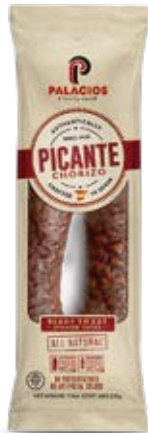
Chorizo Picante Cont. Net.: 225g