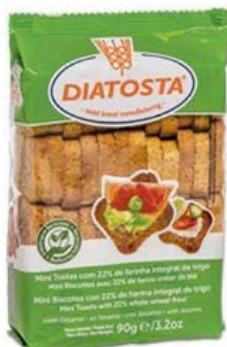
Regular Cont. Net.: 90g