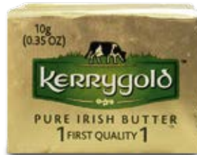
Mantequilla Mini Con Sal Cont. Net.: 10g