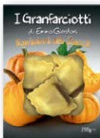
Pumpkin Ravioloni Cont. Net.: 250g