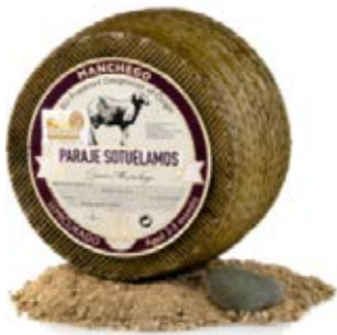
Manchego Semicurado Cont. Net.: 3.45 kg