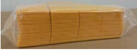
Queso Procesado Sabor Cheddar 2.27 kg (160 slices)