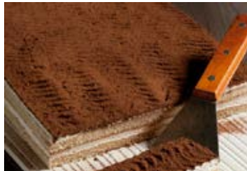
Plancha Tiramisú Cont. Net.: 1.65 kg