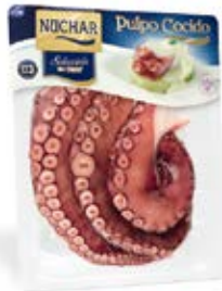
Pulpo Selección Cocido 3 ó 4 patas Cont. Net.:500g