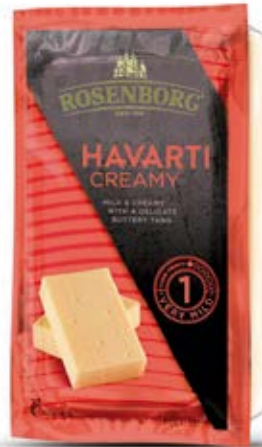
Queso Havarti Cremoso Cont. Net.: 227g