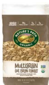
Multigrain Flakes Cont. Net.: 750g