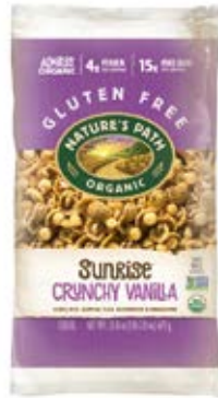
Sunrise Crunchy Vanilla Cont. Net.: 675g