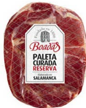
Paleta Curada Reserva Cont. Net.: Peso Variable