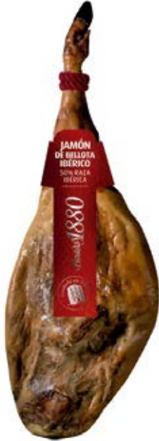
Jamón de Bellota Ibérico Cont. Net.: Peso Variable