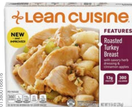
Pechuga De Pavo Asado Cont. Net.: 276g