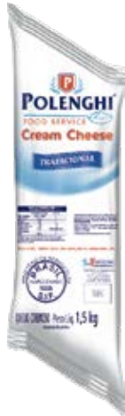
Cream Cheese Cont. Net.: 1.5 kg