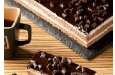
Plancha Trufa Cont. Net.: 1.8 kg