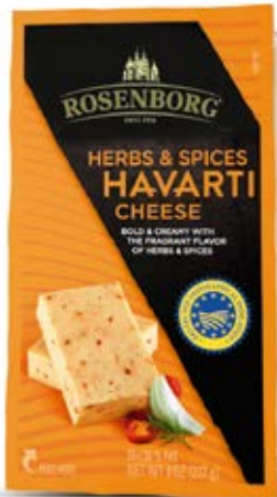
Queso Havarti Con Especies Cont. Net.: 227g