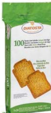
Integral Cont. Net.: 750g.