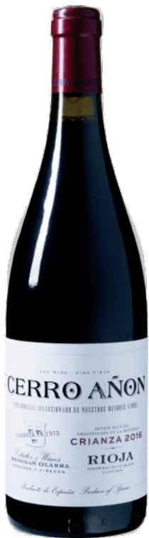
CERRO AÑON CRIANZA D.O.: RIOJA Cont. Net.: 750 ml

El Grupo Bodegas Olarra nace en 1973 con la construcción, a las afueras de Logroño, de una bodega para grandes vinos de Rioja. Técnicas modernas, bajo una cultura tradicional. En 1985 surge Bodegas Ondarre, que exprime al máximo la tipicidad de los viñedos y la diversidad de suelos de Viana. Allí se elaboran vinos de larga crianza y los primeros cavas del grupo. En el año 2000, se inicia el proyecto de Bodegas y Viñedos Casa del Valle que, con la misma filosofía que los vinos de pago, sigue el clásico modelo Château.