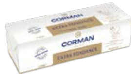
GLACIER EXTRA 99.9% FAT Cont. Net.: 2,5 kg block.