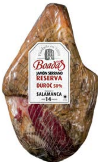
Jamón Serrano Reserva Cont. Net.: Peso Variable