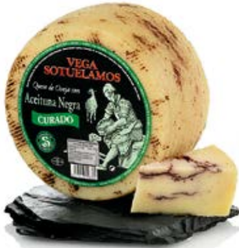
Con Aceituna Negra Cont. Net.: variable