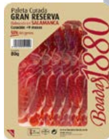
Paleta Curada Gran Reserva Cont. Net.: 80g