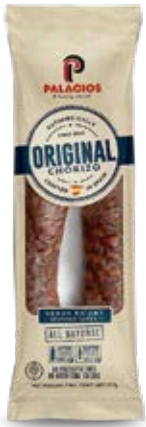
Chorizo Original Cont. Net.: 225g