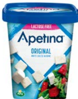
Apetina Cubes in Brine, 1,6 kg Cont. Net.: 1kg