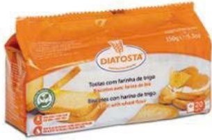
Regular Cont. Net.: 150g.