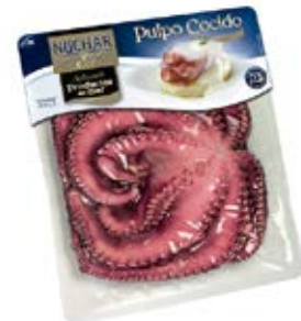
Pulpo Entero Selección Cont. Net.:400g