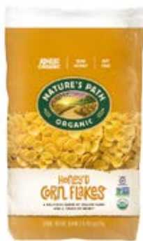
Honey Corn Flakes Cont. Net.: 750g