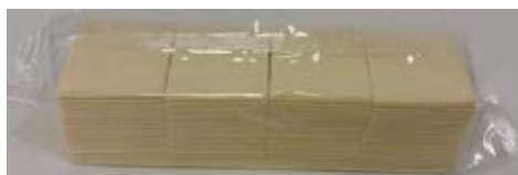
Queso Procesado Con Grasa Vegetal Sabor Gouda 2.27 kg (160 slices)