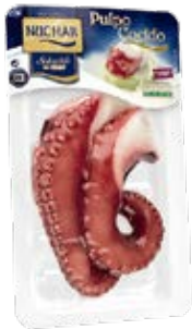
Pulpo Selección Cocido 2 patas Cont. Net.:500g