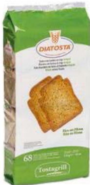
Integral Cont. Net.: 510g.