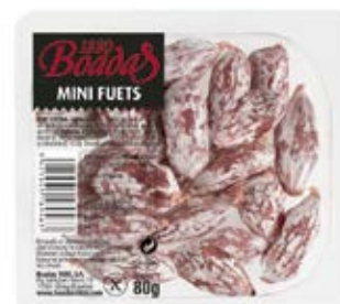
MINI FUETS Cont. Net.: 80g