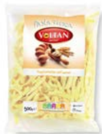
Ravioli con Carne