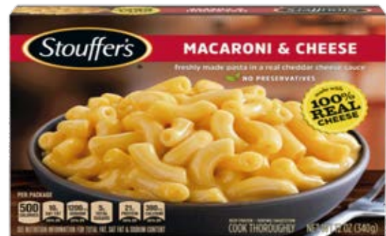
Macarrones Con Queso