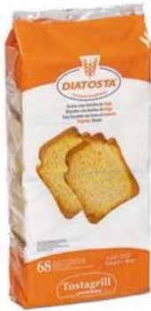
Regular Cont. Net.: 510g.