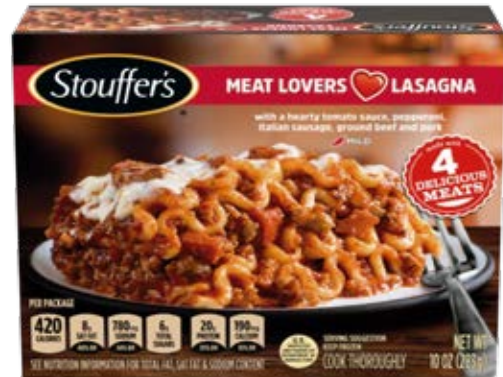
Amantes De La Carne