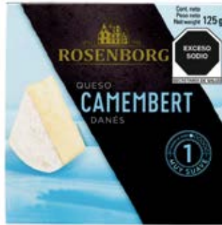
Queso Camembert Cont. Net.: 125g