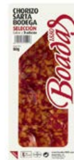
Chorizo Sarta Bodega Selección Cont. Net.: 80g / 300g / 500g