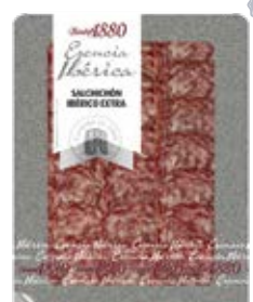
Salchichón Ibérico Extra Cont. Net.: 70g