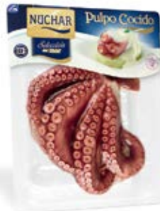
Medio Pulpo Selección Cont. Net.:400g