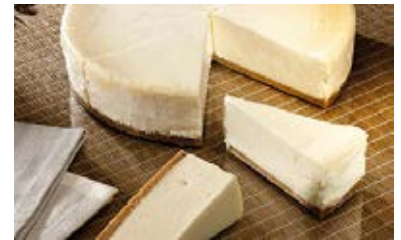
New York Cheesecake Cont. Net.: 1.6 kg