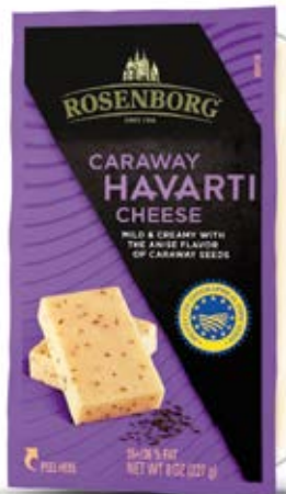
Queso Havarti Alcaravea Cont. Net.: 227g