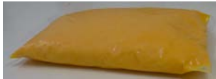
Queso Procesado Sabor Cheddar Cont. Net.: 1 kg