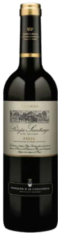
RIOJASANTIAGO CRIANZA D.O: RIOJA Cont. Net.: 750 ml