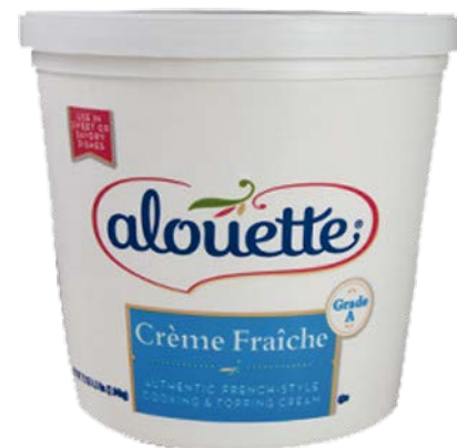
Crème Fraîche Cont. Net.: 4.5lb