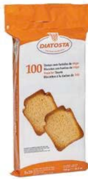
Regular Cont. Net.: 750g.