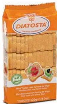
Regular Cont. Net.: 120