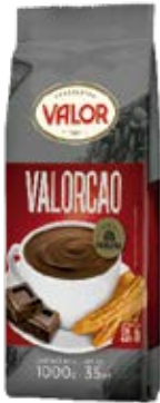
Valorcao a la Taza Cont. Net.: 1kg, 500g, 250g