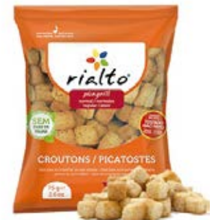
Clasicos Cont. Net.: 100g