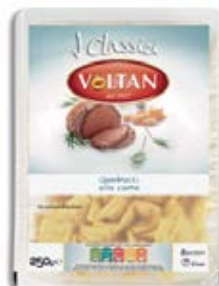
Quadrucci con Carne