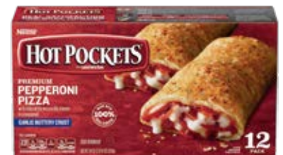
Pepperoni Pizza 12pack