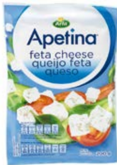
Queso Apetina Feta Bloque Cont. Net.: 200g