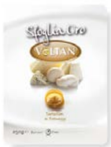
Tortelloni con Queso