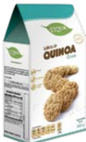
Quinoa con Coco Cont. Net.: 200g