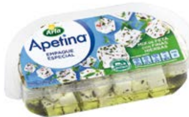
Mix de Feta con finas hierbas Cont. Net.: 100g