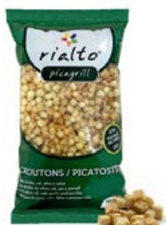
– Ajo y Perejil Cont. Net.: 100g