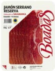
Jamón Serrano Reserva Cont. Net.: 80g