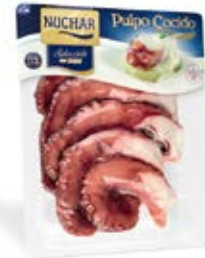
Pulpo Selección Cocido 7 ó 8 patas Cont. Net.:500g