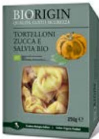
Tortelloni de calabaza y salvia Cont. Net.: 250g