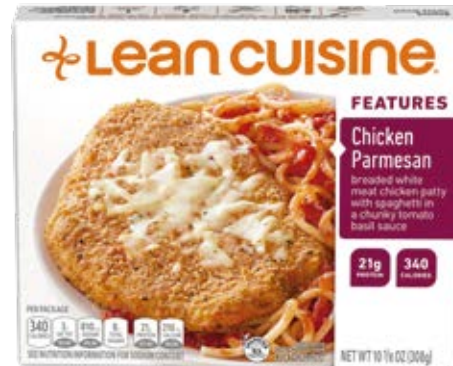
Pollo Con Queso Parmesano Cont. Net.: 308g