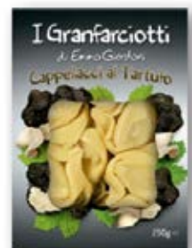
Truffle Cappellacci Cont. Net.: 250g