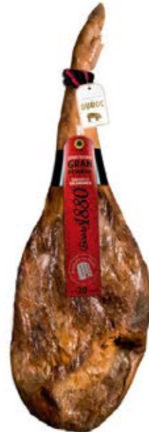
Jamón Serrano Gran Reserva Cont. Net.: Peso Variable