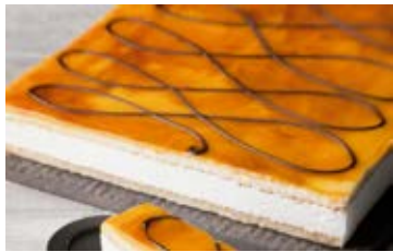
Plancha San Marcos Cont. Net.: 1.8 kg