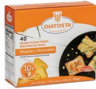
Regular Cont. Net.: 300g.