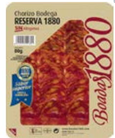
Chorizo Bodega Reserva Cont. Net.: 80g