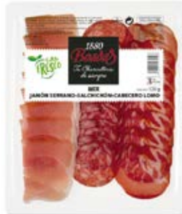
Mix Jamón Serrano + Salchichón Cont. Net.: 120g / 300g + Cabeza Lomo