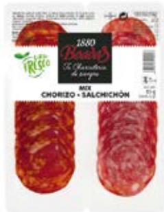
Mix Chorizo + Salchichón Cont. Net.: 85g