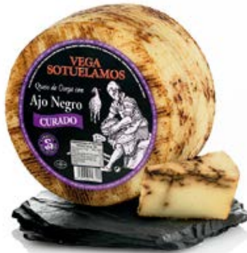
De Oveja Curado Con Ajo Negro Cont. Net.: variable