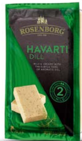
Queso Havarti Eneldo Cont. Net.: 227g