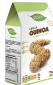
Quinoa Jengibre & Limón Cont. Net.: 200g