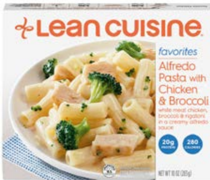
Alfredo Pasta W Chkn Brocoli Cont. Net.: 283g