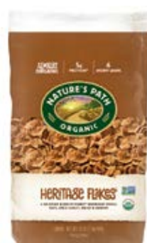
Heritage Flakes Cont. Net.: 750g