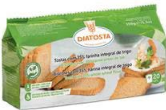
Integral Cont. Net.: 150g.