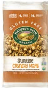
Sunrise Crunchy Maple Cont. Net.: 675g