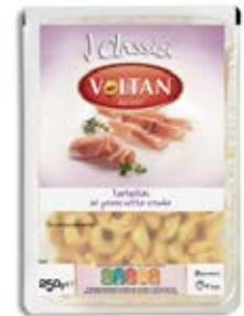
Carne y Jamón Curado