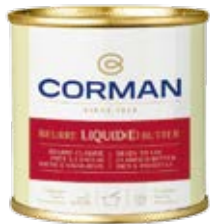
LIQUID CLARIFIED BUTTER 99.9% FAT Cont. Net.: 17 kg tin or 8 x 2 kg tin.