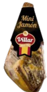
Mini Ham Cont. Net.: 1kg