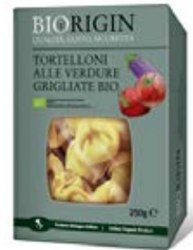
Tortelloni de verduras a la plancha Cont. Net.: 250g