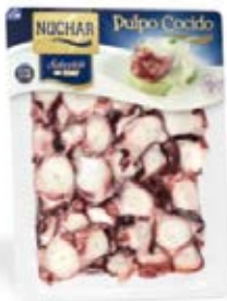
Pulpo Cocido Selección Troseado Cont. Net.:150g/500g