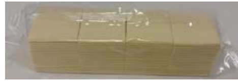
Queso Procesado Con Grasa Vegetal Sabor Mozzarella 2.27 kg (160 slices)