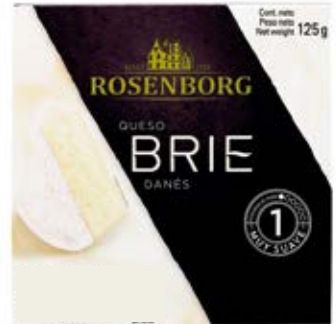
Queso Brie Cont. Net.: 125g