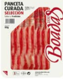
Panceta Curada Cont. Net.: 80g