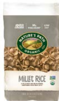
Millet Rice Cont. Net.: 750g