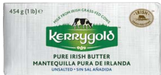
Mantequilla unttable con sal Cont. Net.: 454g