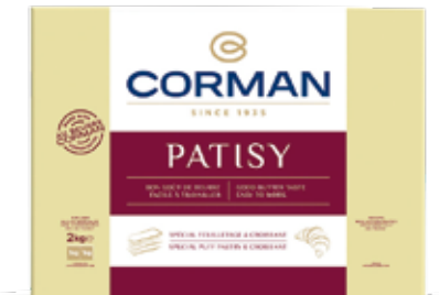
Patisy - Croissant & Puff Pastries 78% Fat Cont. Net.: 2kg