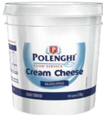
Cream Cheese Cont. Net.: 3.6 kg