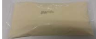
Queso Procesado Sabor Queso Azul Cont. Net.: 1 kg