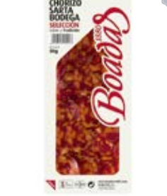
Chorizo Sarte Bodega Cont. Net.: 80g