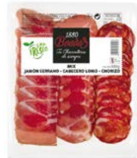
Mix Jamón Serrano + Cabeza Cont. Net.: 120g / 300g Lomo + Chorizo