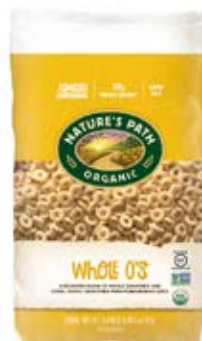
Whole O's Cont. Net.: 750g