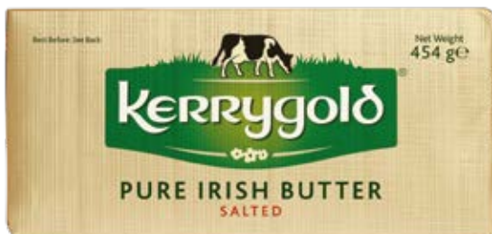
Mantequilla unttable con sal Cont. Net.: 454g