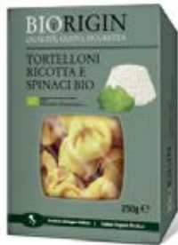
Tortelloni de espinacas y ricotta Cont. Net.: 250g