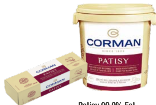
Patisy 99.9% Fat Cont. Net.: 2.5kg / 17kg