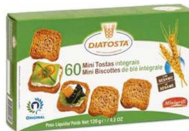
Regular Cont. Net.: 120