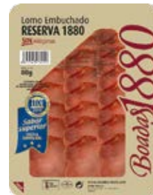
Lomo Embuchado Reserva Cont. Net.: 80g