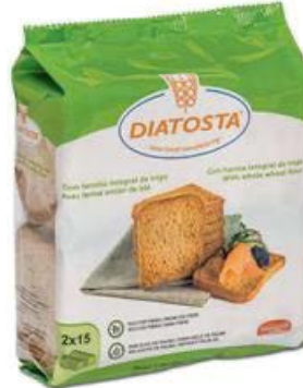
Integral Cont. Net.: 225g (2 x 112g).