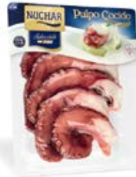
Pulpo Selección Cocido 5 ó 6 patas Cont. Net.:500g