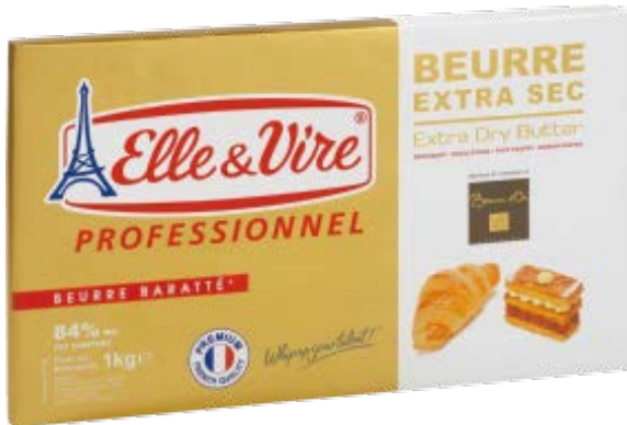
Mantequilla Extra Seca 84% Fat Cont. Net.: 1 kg