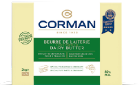
Dairy Butter Premium Fat Croissant & Puff Pastries 82 % Fat Cont. Net.: 2kg