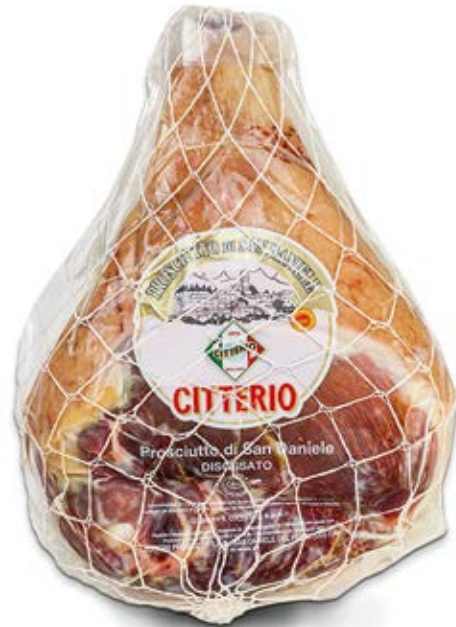
Prosciutto San Danielle Cont. Net.: 6.80 kg