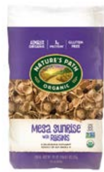
Mesa Sunrise Cont. Net.: 825g