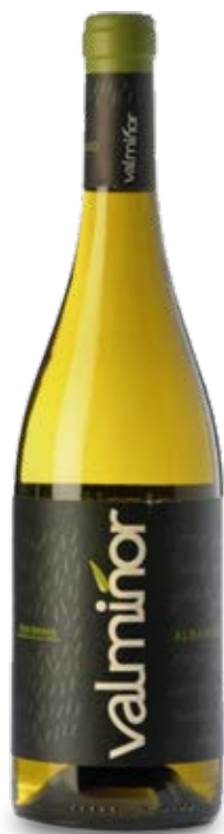
VALMIÑOR ALBARIÑO D.O.: RÍAS BAIXAS Cont. Net.: 750 ml

Valmiñor es una bodega moderna en Rías Baixas con fuertes raíces celtas. Su misión es ser líderes en el sector vitivinícola español. Naturaleza, experiencia, tecnología y un excelente servicio al cliente ... todos estos factores han permitido a Valmiñor ofrecer una amplia gama de vinos, no solo reconocidos por su calidad y variedad, sino también por su carácter innovador. A pesar de ser una bodega moderna con tecnología de vanguardia, Valmiñor se dedica a honrar sus raíces celtas. Cada etiqueta de Valmiñor retrata cuatro símbolos celtas: lluvia, sol, aire y tierra, descubiertos de antiguas marcas excavadas en una montaña cercana.