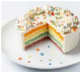
Rainbow Cake Cont. Net.: 1.17kg