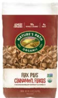
Flax Plus Cinnamon Cont: Net. 825g