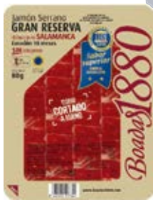
Jamón Serrano Gran Reserva Cont. Net.: 80g