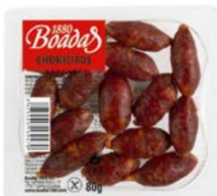
CHORICITOS Cont. Net.: 80g