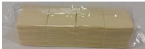
Queso Procesado Con Grasa Vegetal Sabor Queso Blanco 2.27 kg (160 slices)