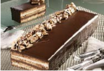
Plancha Tarta de la Abuela Cont. Net.: 1.9 kg