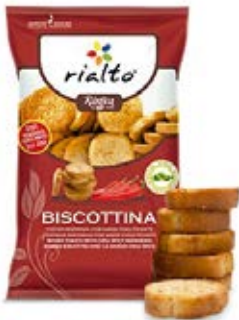
Chile Cont. Net.: 100g