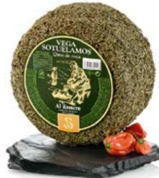
Queso Añejo Envejecido Al Romero Cont. Net.: variable