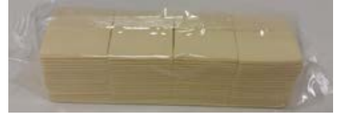
Queso Procesado Sabor Emmental 2.27 kg (160 slices)