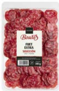
Fuet Extra Selección Cont. Net.: 80g / 300g / 500g