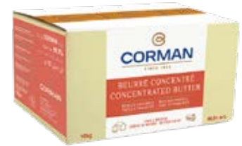
'PÂTISSIER' CONCENTRATED INCORPORATION BUTTER Cont. Net.: 10 kg block or 25 kg block.