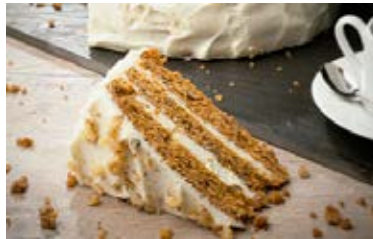
Carrot Cake Cont. Net.: 1.9 kg