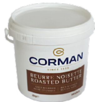
Beurre Noisette Cont. Net.: 2kg