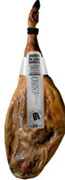
Jamón De Cebo Ibérico Cont. Net.: Peso Variable