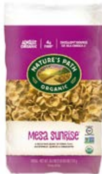
Mesa Sunrise Cont. Net.: 750g