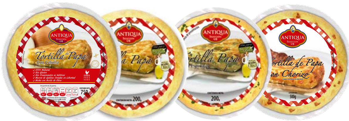
Tortilla Española Tradicional (Chorizo Con Cebolla Sin Cebolla, Espinacas) Cont. Net.: 200g / 500g / 750g