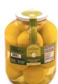
Melocoton en Almibar Contenido Neto: 660g / 1,700g / 2,650g