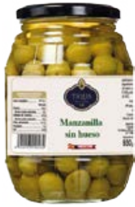
Manzanilla sin Hueso Cont. Net.: 500g / 680g / 1.4 Kg