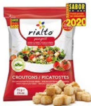
Tomate y Oregano Cont. Net.: 100g