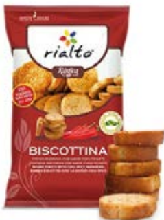
Chile Cont. Net.: 100g