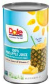
Jugo Piña Cont. Net.: 1.36 L