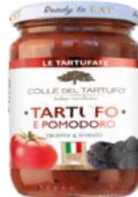
Trufa & Tomate Cont. Net.: 180g