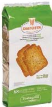
Integral Cont. Net.: 510g.