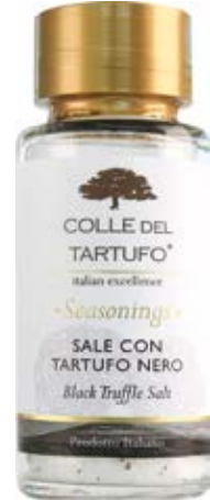
Sal de Trufa Negra Cont. Net.: 100g