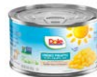
Trocitos Cont. Net.: 227g