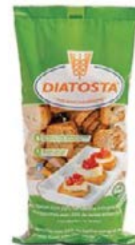
Regular Cont. Net.: 180g