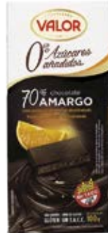
70 % de Naranja Sin Azúcar Cont. Net.: 100g