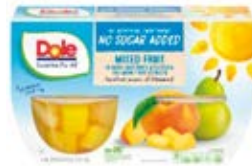
Mix de Fruta 4-Packs (452g)