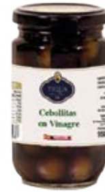
Cebollita en Vinagre Balsámico de Módena