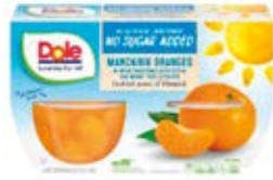
Mandarina 4-Packs (452g)