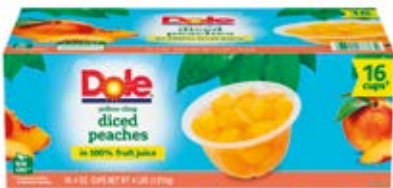
Duraznos en Cubos Cont. Net.: 1.36 L