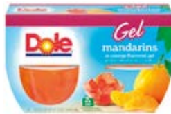
Mandarina en Gelatina de Naranja Cont. Net.: 4-Packs (492g.)