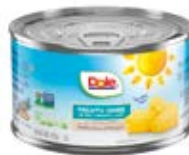
Machacada Cont. Net.: 227g