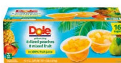
8 de Duraznos + 8 de Mix de Frutas Cont. 1.81 kg (16x118ml)