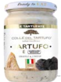
Trufa & Parmeggiano Reggiano Cont. Net.: 180g