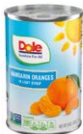
Mandarina En Almíbar Ligero Cont. Net.: 425g