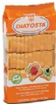
Regular Cont. Net.: 120