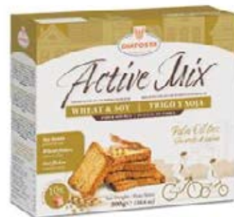
Active Mix – Integral y Soja Cont. Net.: 300g.