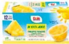
Piña Cont. Net.: 1.3kg