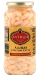
Alubia Antiquera Extra Cont. Net.: 540g