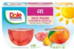
Durazno en Gelatina de Sandía Cont. Net.: 4-Packs (492g.)