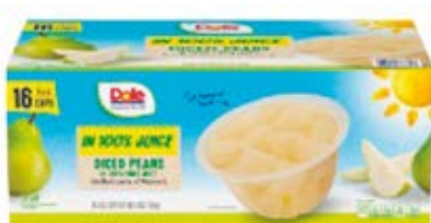
Pera Cont. 1.81 kg (16x118ml)