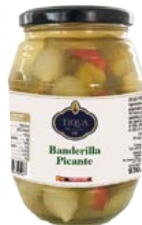
Banderilla Picante Trozo Cont. Net.: 500g / 680g / 1.4 Kg