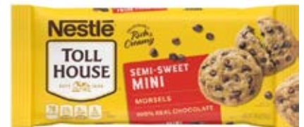
Chocolate Semi Dulce Cont. Net.: 326g