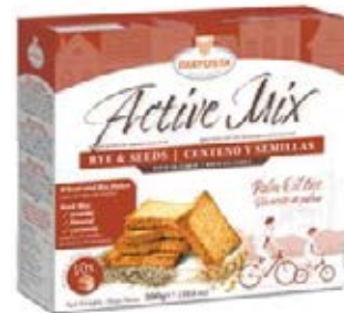
Active Mix – Centeno y Semillas Cont. Net.: 300g.