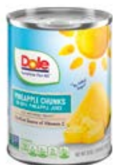
Trozos Cont. Net.: 567g