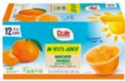
Mandarinas Cont. Net.: 1.3kg