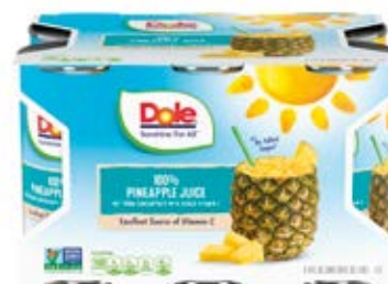
Jugos de Piña Cont. 1.6 L (6x177ml)