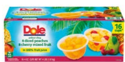
Jugos de Pina Cont. 1.81 kg (16x118ml)