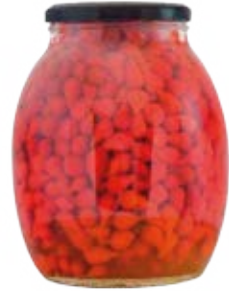
Sweety Drop Cont. Net.: 42 oz