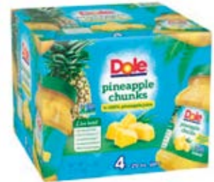
Trozos de Piña en Frasco Cont. Net.: 2.27 L. (4x567g.)