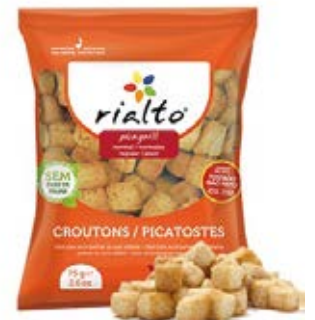
Clasicos Cont. Net.: 100g