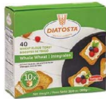
Integral Cont. Net.: 300g.