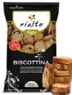
Pasas Cont. Net.: 100g