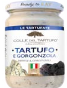
Gorgonzola Cont. Net.: 180g