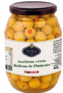
Aceituna Verde Rellana de Pimiento Cont. Net.: 500g / 680g / 1.4 Kg