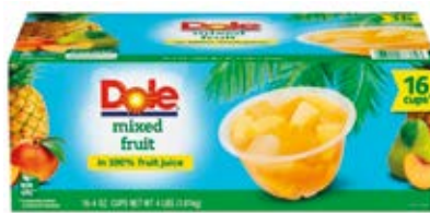
Pera Cont. 1.81 kg (16x118ml)