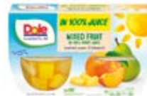
Mix de Frutas Cont. Net.: 452g