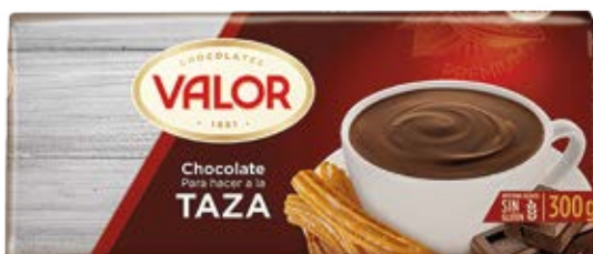
Chocolate para Hacer a la Taza Valor Cont. Net.: 300g