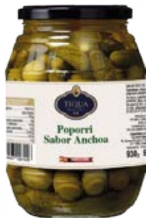
Popurrí Sabor Anchoa Cont. Net.: 500g / 680g / 1.4 Kg