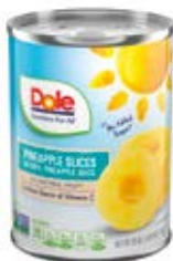
Rebanados Cont. Net.: 567g