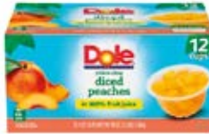
Duraznos Cont. Net.: 1.3kg