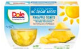
Piña 4-Packs (452g)