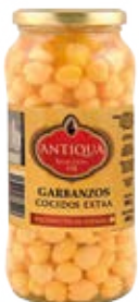
Garbanzos Cocidos Extra Cont. Net.: 540g