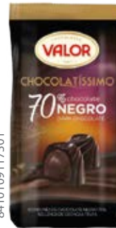
Chocolatissimo Sin Azúcar Añadida Cont. Net.: 100g