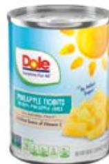
Trocitos Cont. Net.: 567g