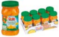
Trozos de Piña en su Jugo