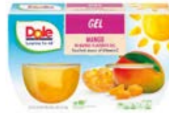
Mango en Gelatina Cont. Net.: 4-Packs (492g.)