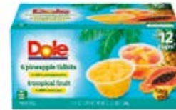
6 de Piña + 6 de Fruta Tropical Cont. Net.: 1.3kg