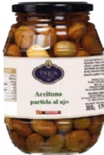
Aceituna Verde Partida al Ajo Cont. Net.: 500g / 680g / 1.4 Kg