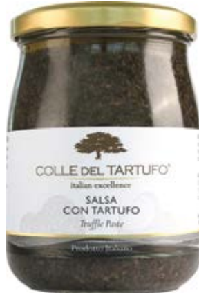
Pasta con Trufa Cont. Net.: 180g