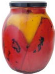
Roasted Red & Yellow Pepper Cont. Net.: 42 oz