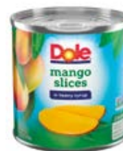
Mango en Almíbar Cont. Net.: 432g