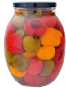
Sweetypepp Tricolor Cont. Net.: 42 oz