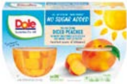
Duraznos 4-Packs (452g)