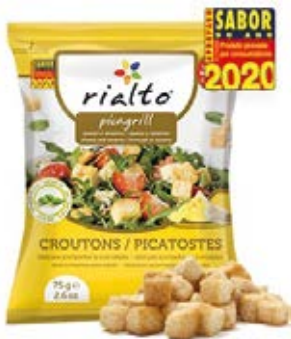
Queso y Sesamo Cont. Net.: 100g