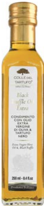
Aceite de Trufa Negra (Virgen Extra) Cont. Net.: 60mL, 100mL, 250mL