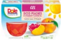
Durazno en Gelatina de Fresa Cont. Net.: 4-Packs (492g.)