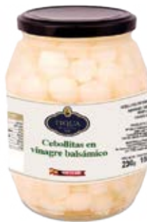
Cebollitas en Vinagre Cont. Net.: 500g / 680g / 1.4 Kg