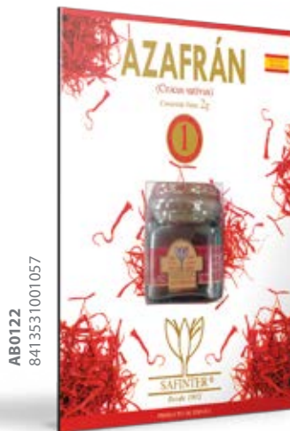
Azafrán Cont. Net.: 2 g

En la búsqueda de productos de calidad, Safinter SA comenzó con la comercialización de La Vera Paprika. Esta especia se obtiene de pimiento rojo producido en el condado de 'La Vera' en España. La empresa SA mantiene un acuerdo con una Asociación de Agricultores en el país de La Vera que realiza la selección en el origen de los pimientos de mejor calidad.