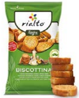
Biscottina – Cesar y Hierbas Finas Cont. Net.: 100g