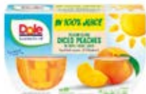
Duraznos En Cubos Cont. Net.: 452g