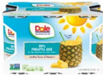
Jugo De Piña 100% Cont. 1.6 L (6x177ml)