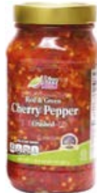
Red & Green Cherry Pepper Cont. Net.: 8 oz