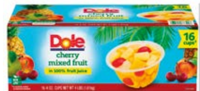
Mix de Fruta con Cereza Cont. 1.6 L (6x177ml)