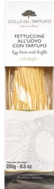
Pasta Fettuccini con Trufa Cont. Net.: 250g