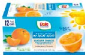
Mandarina Cont. Net.: 12 pack