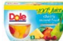
Mix de Frutas con Cereza Cont. Net.: 452g