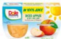
Manzanas Cont. Net.: 452g