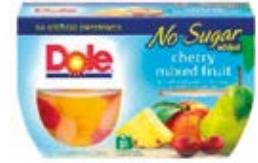
Mix de Fruta con Cereza 4-Packs (452g)