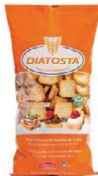
Regular Cont. Net.: 350g