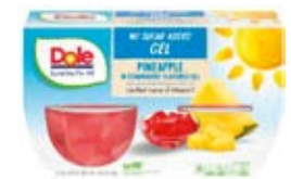
Piña en Gelatina de Fresa Sin Azucares Añadidos Cont. Net.: 4-Packs (492g.)