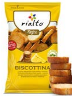
Queso Cont. Net.: 100g