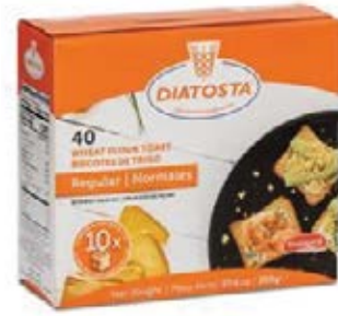
Regular Cont. Net.: 300g.