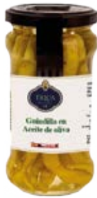
Guindilla en Aceite de Oliva