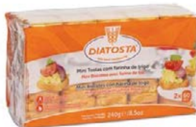
Regular Cont. Net.: 240g