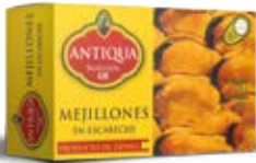
Mejillones en Escabeche Cont. Net.: 112g