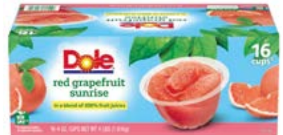
Toronjas Cont. 1.81 kg (16x118ml)