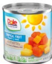
Fruta Tropical (piña y papaya) en Almíbar Jugo de Maracujá Cont. Net.: 432g