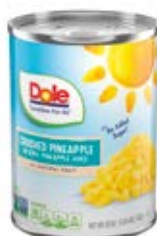
Machacada Cont. Net.: 567g