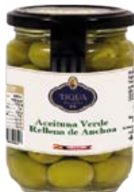
Aceituna Verde Rellena de Anchoa