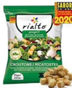
Ajo y Perejil Cont. Net.: 100g