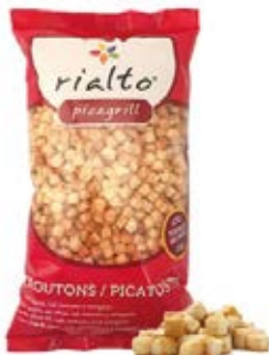
Tomate y Oregano Cont. Net.: 100g