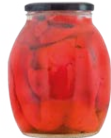
Whole Roasted Red Pepper Cont. Net.: 42 oz