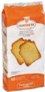
Regular Cont. Net.: 510g.