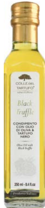
Aceite de Oliva con Trufa Negra Cont. Net.: 250mL