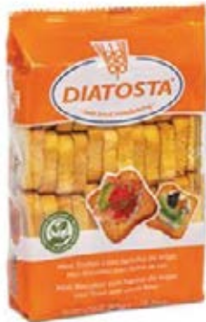
Regular Cont. Net.: 150g