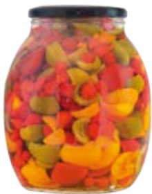
Sweety Drop & Sweetypepp Cont. Net.: 42 oz