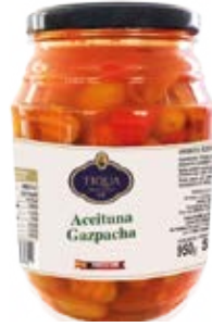
Aceituna Gazpacha Cont. Net.: 500g / 680g / 1.4 Kg