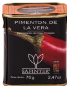
Pimentón Agridulce Cont. Net.: 70 g