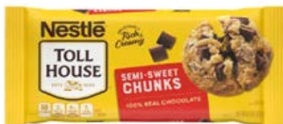
Chocolate semi dulce en trozos Cont. Net.: 326g