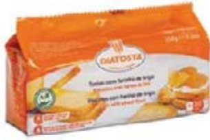
Regular Cont. Net.: 150g.