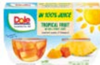
Fruta Tropical Cont. Net.: 452g