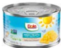
Trozos Cont. Net.: 227g