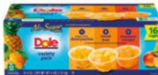
4 -Duraznos 8-Mix de Fruta 4-Mandarina Cont. Net.: 16 pack