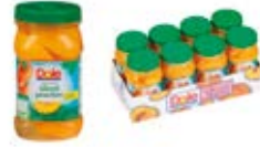
Duraznos(Rebanadas) En Almíbar Ligero