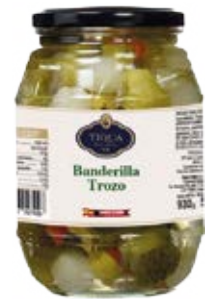
Banderilla Dulce Trozo Cont. Net.: 500g / 680g / 1.4 Kg