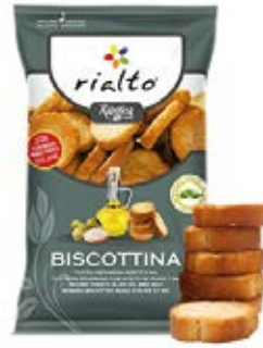
Redondas Aceite y Sal Cont. Net.: 100g