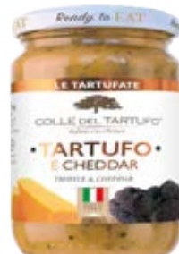
Trufa & Cheddar Cont. Net.: 180g