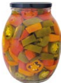
Tricolor Jalapeno Cont. Net.: 42 oz