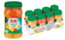
Fruta Tropical En Almíbar Ligero