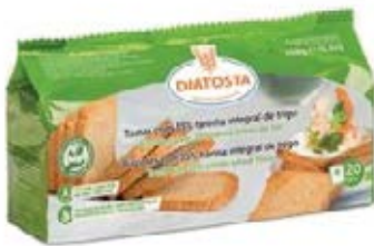
Integral Cont. Net.: 150g.