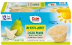
Pera Cont. Net.: 1.3kg