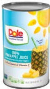
Jugo De Piña 100% Cont. Net.: 1.36 L