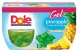
Piña en Gelatina de Limón Cont. Net.: 4-Packs (492g.)