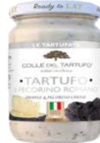
Trufa & Pecorino Romano Cont. Net.: 180g