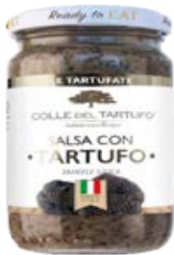
Trufa Cont. Net.: 180g