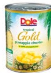
Pina Gold en Trozos Cont. Net.: 567g