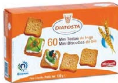
Regular Cont. Net.: 120