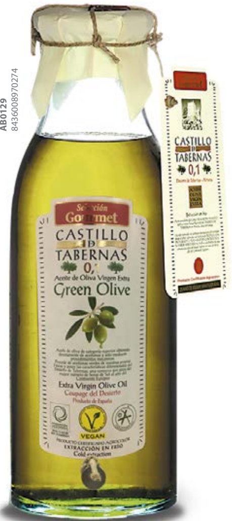
Aceite de Oliva - Green Olive Magnum Cont. Net.: 5 lt