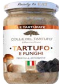
Trufa & Funghi Cont. Net.: 180g