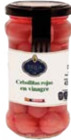
Cebollitas Rojas en Vinagre