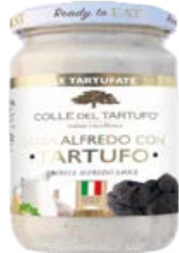
Salsa Alfredo con Trufa Cont. Net.: 180g