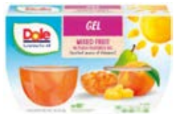
Mix de Fruta en Gelatina de Durazno Cont. Net.: 4-Packs (492g.)