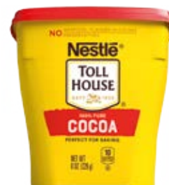
Chocolate 100% puro Cont. Net.: 226g