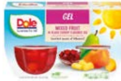
Mandarina en Gelatina de Naranja Cont. Net.: 4-Packs (492g.)