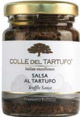
Salsa de Trufa Cont. Net.: 90g