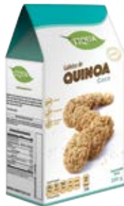
Quinoa con Coco Cont. Net.: 200g