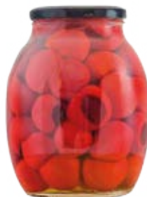
Red Sweetypepp Cont. Net.: 42 oz