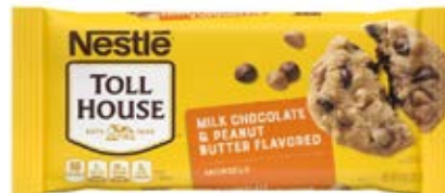
Chocolate Con Leche y Mantequilla Cont. Net.: 326g