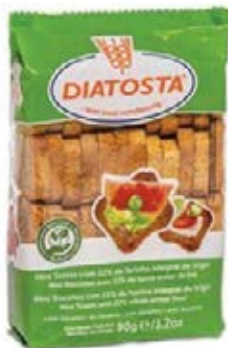
Regular Cont. Net.: 90g