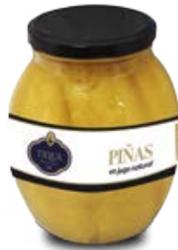
Piña en Tiras en su Jugo Cont. Net.: 42 oz