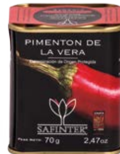
Pimentón Picante Cont. Net.: 70 g