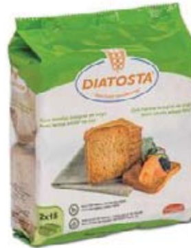
Integral Cont. Net.: 225g (2 x 112g).