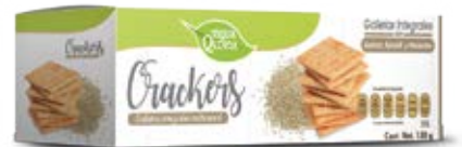
Multicereal con Chia Cont. Net.: 150g