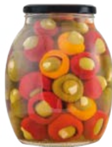
Sweetypepp Stuffed with Olive Cont. Net.: 42 oz