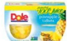
Piña en Trocitos Cont. Net.: 452g