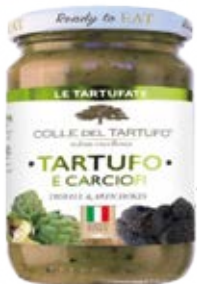
Trufa & Alcachofa Cont. Net.: 180g