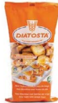
Regular Cont. Net.: 180g