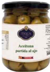
Aceituna Partida al Ajo