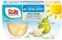
Pera 4-Packs (452g)