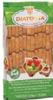
Regular Cont. Net.: 120