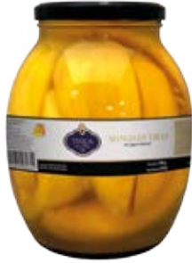
Mango en Tiras en su Jugo Cont. Net.: 42 oz