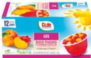
Durazno en Gelatina de Fresa Cont. Net.: 12 pack