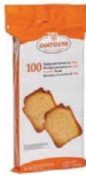
Regular Cont. Net.: 750g.