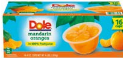
Mandarinas Cont. Net.: 177 ml