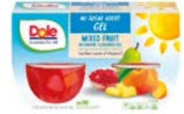
Mix de Fruta en Gelatina de Cereza Sin Azucares Añadidos Cont. Net.: 4-Packs (492g.)