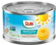
Rebanados Cont. Net.: 227g