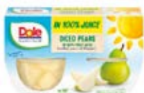
Pera Cont. Net.: 452g