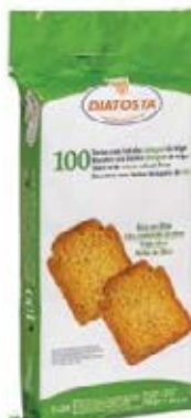
Integral Cont. Net.: 750g.