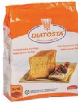
Regular Cont. Net.: 225g (2 x 112g).