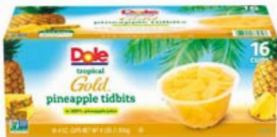
Piña de Frutas Cont. 1.81 kg (16x118ml)