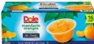
Mandarina Cont. Net.: 16 pack