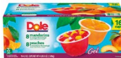
8-Mandarina en Gelatina de Naranja 8-Durazno en Gelatina de Fresa Cont. Net.: 16 pack