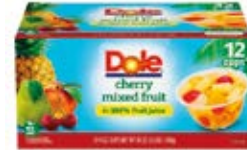
Mix de Frutas con Cereza Cont. Net.: 1.3kg