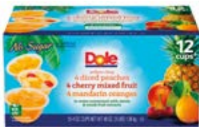
4 -Duraznos 4-Mix de Fruta con Cereza 4-Mandarina Cont. Net.: 16 pack