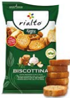
Redondas Ajo y Perejil Cont. Net.: 100g