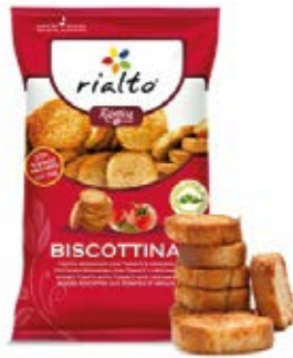
Redondas Tomate y Orégano Cont. Net.: 100g