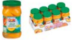
Mandarina En Almíbar Ligero