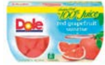
Toronja Cont. Net.: 452g