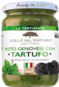
Trufa & Pesto Cont. Net.: 180g