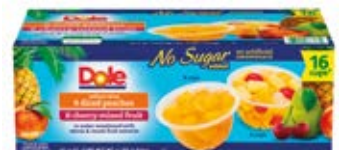
8 -Duraznos 8-Mix de Fruta Cont. Net.: 16 pack