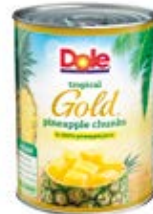
Piña Gold en Trozos Cont. Net.: 567g