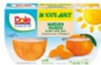
Mandarinas Cont. Net.: 452g