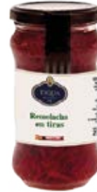
Remolacha en Tiras