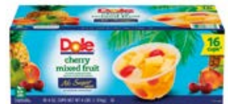
Mix de Fruta con Cereza Cont. 1.6 L 16 pack