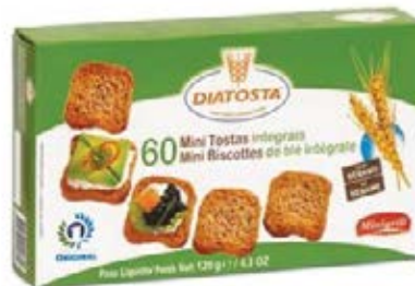
Regular Cont. Net.: 120