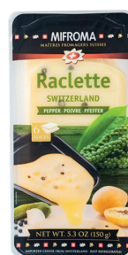
Queso Raclette con Pimiento Verde Cont. 150g