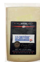
Queso Gruyère Cave d'or 14 meses Cont. 200g