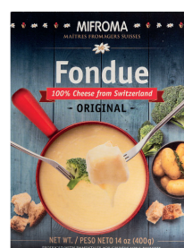
Fondue Original Cont. 400g