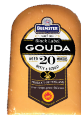
Black Label Gouda 20 meses de maduración Cont. 500g