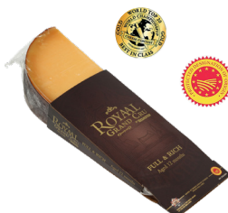
Royal Grand Cru 12 meses de maduración Cont. 150g