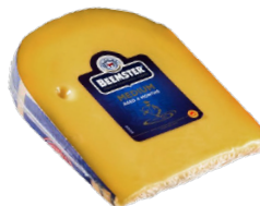
Medium 4 meses de maduración Cont. 250g