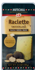
Queso Raclette con Trufa Cont. 150g