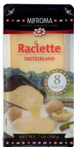
Queso Raclette Cont. 200g