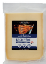
Queso Gruyère Cont. 200g