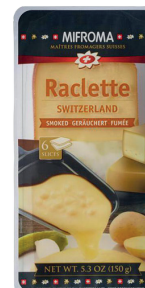
Queso Raclette Ahumado Cont. 150g