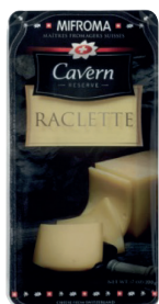
Queso Raclette Cavern Cont. 200g