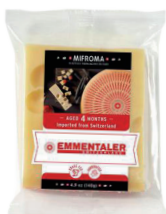
Queso Emmentaler 4 meses Cont. 140g