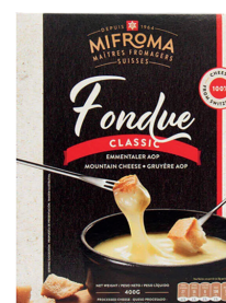
Fondue Classic / Sin Alcohol Cont. 400g