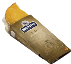
X-0 26 meses de maduración Cont. 150g