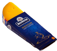
Medium 4 meses de maduración Cont. 150g