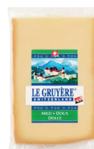
Queso Gruyère AOP mild Cont. 200g