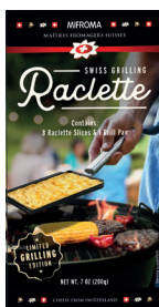
Queso Raclette Grill Original Cont. 200g