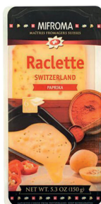
Queso Raclette con Paprika Cont. 150g