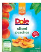
Duraznos Cont. Net.: 907g