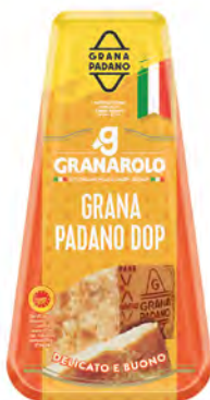
Grana Padano DOP Cont. Net.: 150/200g