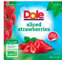
Fresas rebanadas Cont. Net.: 396g