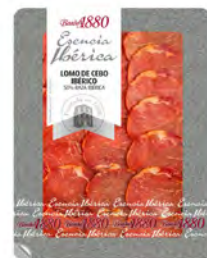
Lomo Ibérico de Cebo Cont. Net.: 70g