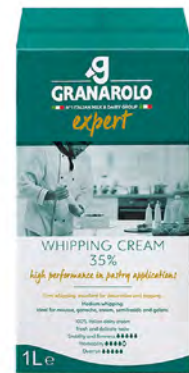
Crema para Batir Cont. Net.: 1L