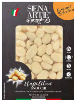
Napolitano Cont. Net.: 500g