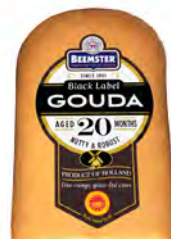
Black Label Gouda 20 meses de maduración Cont. Net.: 500g