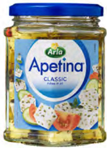
Queso Apetina Cubos en Aceite y finas Hierbas Cont. Net.: 265g