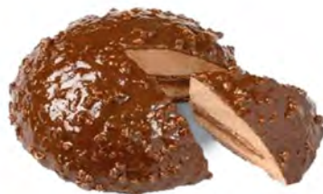
Bonbon Cake Cont. Net.: 725g