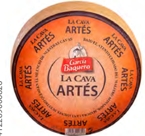
La Cava Artés Cont. Net.: 4 kg