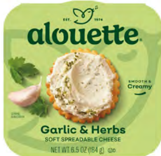
Ajo y Hierbas Cont. Net.: 184g