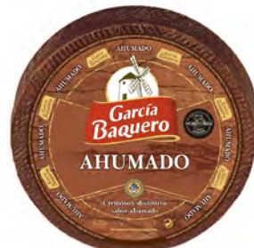
Ahumado Cont. Net.: 3 kg