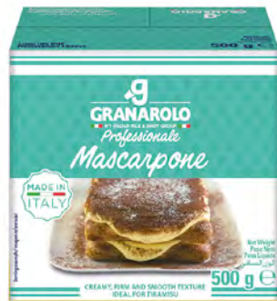
Mascarpone 42% Fat Cont. Net.: 500g