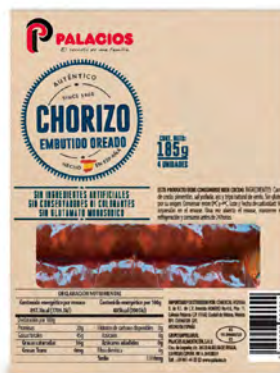
Chorizo Bipack Cont. Net.: 185g