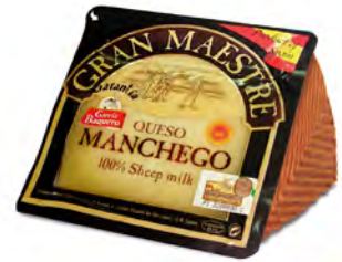
Manchego Gran Maestro Cont. Net.: 300g