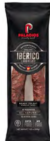
Chorizo Ibérico Cont. Net.: 200g