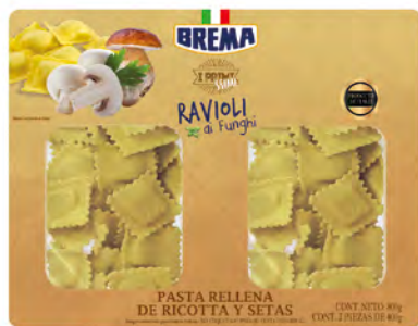
Ricotta y Setas Cont. Net.: 800g