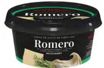
Romero Cont. Net.: 125g