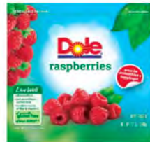
Frambuesas Cont. Net.: 340g