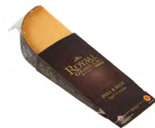
Royal Grand Cru 12 meses de maduración Cont. Net.: 150g