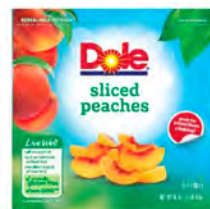
Duraznos Cont. Net.: 454g