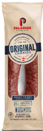
Chorizo Original Cont. Net.: 225g