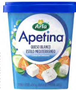
Queso Apetina Feta en Salmuera Cont. Net.: 430g