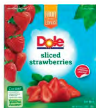
Fresas rebanadas Cont. Net.: 1.4 kg