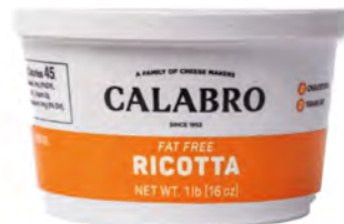
Ricotta sin grasa Cont. Net.: 450g