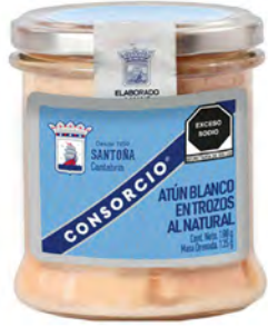
Atún Blanco al natural