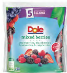
Mix berries (fresa, moras, arándanos y frambuesas)