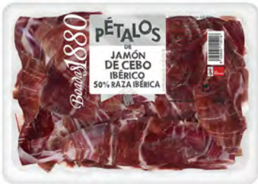
Jamón de Cebo Ibérico Cont. Net.: 80g