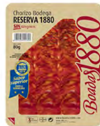
Chorizo Bodega Reserva Cont. Net.: 80g