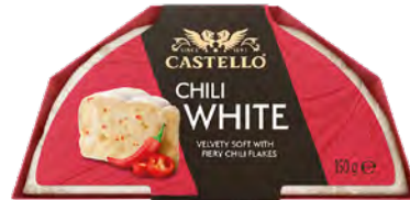
Chili White Cont. Net.: 150g