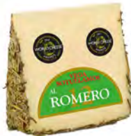
Al Romero Cont. Net.: Variable