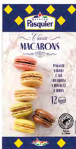
Macarons Franceses Cont. Net.: 154g 12 uds