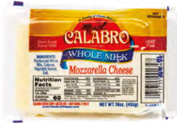
Mozzarella leche entera Cont. Net.: 453g