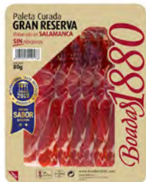
Paleta Curada Gran Reserva Cont. Net.: 80g