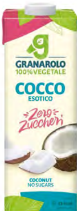
Coco Cont. Net.: 1L