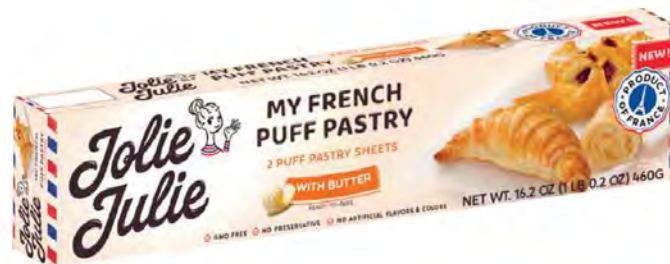
Mi masa de Hojaldre con mantequilla Cont. Net.: 230g