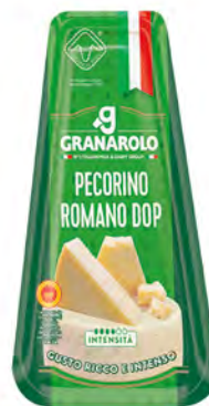
Pecorino Romano Cont. Net.: 150g