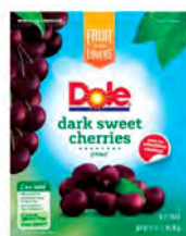
Cerezas Cont. Net.: 907g