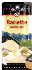
Raclette Cont. Net.: 95g