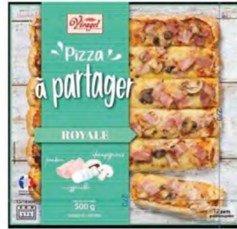
Jamón, queso y champiñones Cont. Net.: 500g