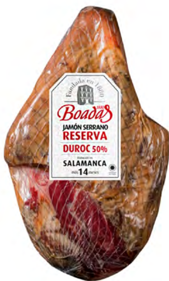
Jamón Serrano Reserva Cont. Net.: Peso Variable