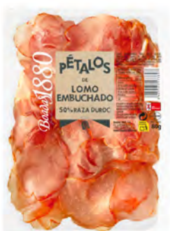
Lomo Embuchado Cont. Net.: 80g