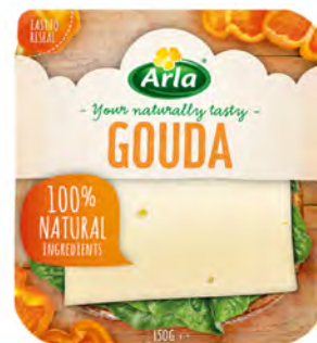
Lonchas Gouda Cont. Net.: 150g