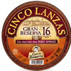
Gran Reserva 16 Cont. Net.: 3 kg