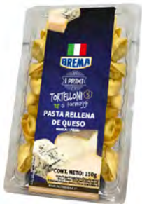
Queso Cont. Net.: 250g