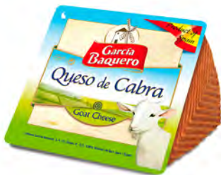
Queso de Cabra Cont. Net.: 150g / 250g