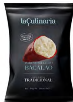
Pimientos Rellenos de Bacalao Cont. Net.: 1kg