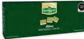
Mantequilla mini con sal Cont. Net.: 315g (50 pzas de 6.3 c/u)