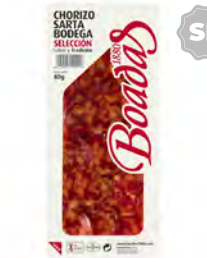
Chorizo Sarte Bodega Cont. Net.: 80g