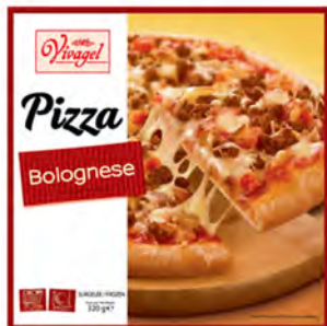
Boloñesa Cont. Net.: 320g