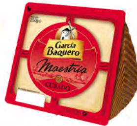
Ibérico Curado Cont. Net.: 250g