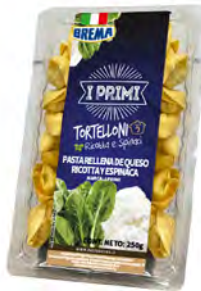
Queso Ricotta y espinaca Cont. Net.: 250g