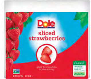
Fresas rebanadas Cont. Net.: 2.7 kg