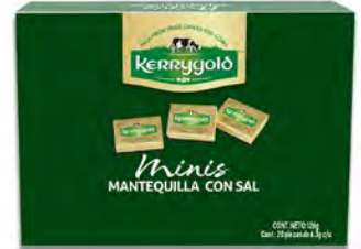
Mantequilla mini con sal Cont. Net.: 630g (100 pzas de 6.3 c/u)