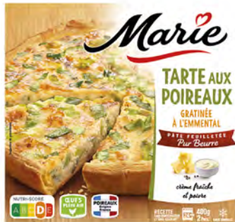
Tarta salada de Porros Cont. Net.: 400g