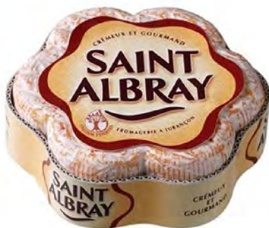
Saint Albray Cont. Net.: 250g