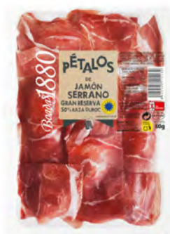
Jamón Serrano Gran Reserva Cont. Net.: 80g