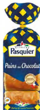
Pan de Chocolate Cont. Net.: 6 uds / 270g