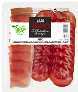
Mix Jamón Serrano + Salchichón + Cabeza Lomo Cont. Net.: 120g / 300g