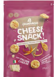
Cebolla Caramelizada Cont. Net.: 24g/60g