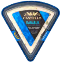
Queso Azul Cont. Net.: 100g