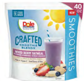
Arándano, fresa y platano Cont. Net.: 1.36 L