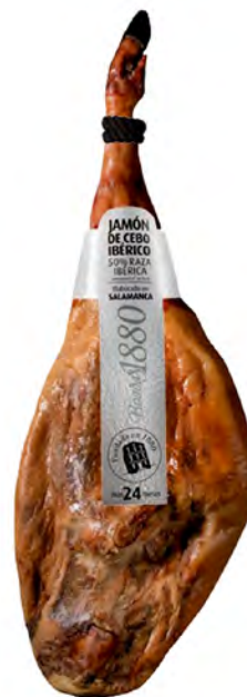
Jamón de Cebo Ibérico Cont. Net.: Peso Variable