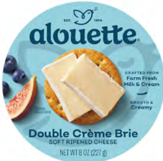
Doble Crema Brie Cont. Net.: 227g