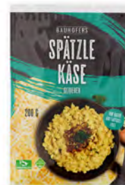
Spätzle Käse Cont. Net.: 200g