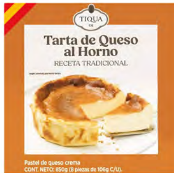
Queso al Horno Cont. Net.: 880g