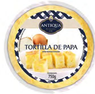
Tortilla Española Clásica Cont. Net.: 750g

200g RE0278 / 8420878597983 500g RE0096 / 8420878033535