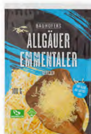
Emmentaler Cont. Net.: 100g