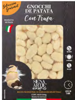
Patata con Trufa Cont. Net.: 500g