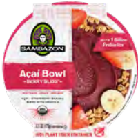
Açaí strawberry banana Cont. Net.: 173g