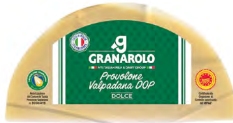
Provolone Cont. Net.: 180g