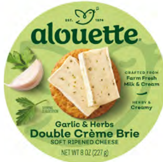
Doble Crema Ajo y Hierbas Cont. Net.: 227g