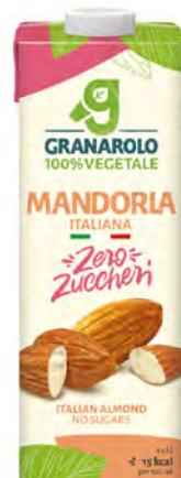
Almendra Cont. Net.: 1L