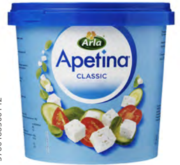
Apetina Cubos en Salmuera Cont. Net.: 1.6 Kg