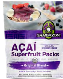
Açaí super fruit packs Cont. Net.: 400g