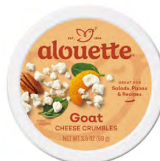
Queso de Cabra Cont. Net.: 127g