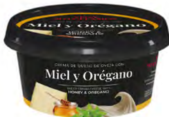
Miel Orégano Cont. Net.: 125g