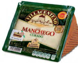
Manchego Villacenteno Cont. Net.: 250g