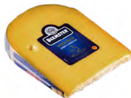
Medium 4 meses de maduración Cont. Net.: 250g