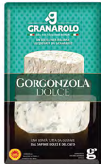
Dulce Dop Cont. Net.: 200g