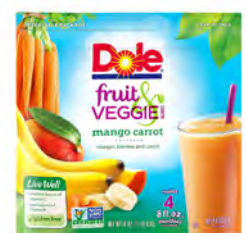
Mango, platano y zanahoria Cont. Net.: 454g