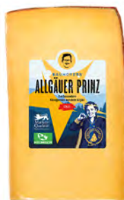
Prinz con Picante Cont. Net.: 200g