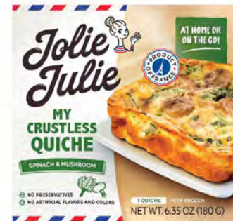
Espinaca y Hongos Cont. Net.: 180g