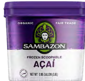
Açaí frozen scoopable Cont. Net.: 3.6 L