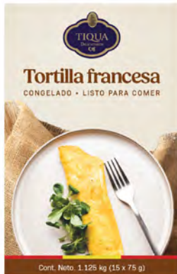
Tortilla de huevo Francesa Cont. Net.: 1.125g / 300g