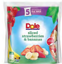
Fresa y platano