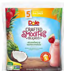
Fresa, sandía, platano, piña y coco Cont. Net.: 5 bolsas (226g)