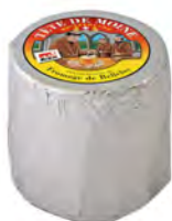
Tête de Moine Clásico Cont. Net.: 95g