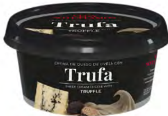
Trufa Cont. Net.: 125g