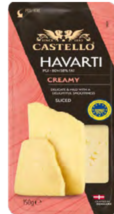
Creamy Havarti Sliced Cont. Net.: 200g