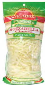
Mozzarella rallada semidesnatada Cont. Net.: 227g