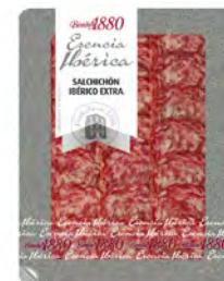
Salchichón Ibérico Extra Cont. Net.: 70g