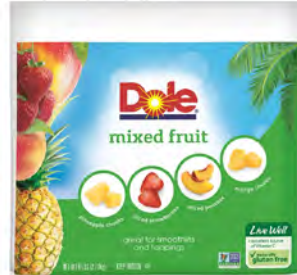
Mix de frutas (fresa, piña, mango y duraznos) Cont. Net.: 2.7 kg