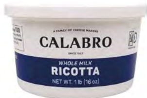
Ricotta con leche entera Cont. Net.: 450g