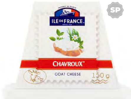
Queso de Cabra Cont. Net.: 150g