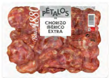
Chorizo Ibérico Extra Cont. Net.: 80g