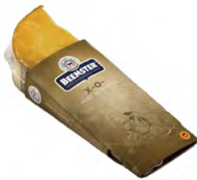
X-0 26 meses de maduración Cont. Net.: 150g