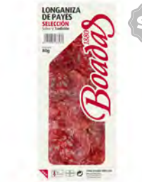
Longaniza de Payes Selección Cont. Net.: 80g