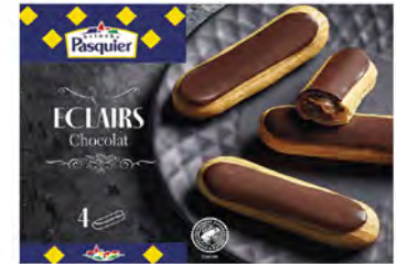
Eclairs de Chocolate Cont. Net.: 4 uds / 240g