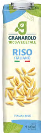
Arroz Cont. Net.: 1L