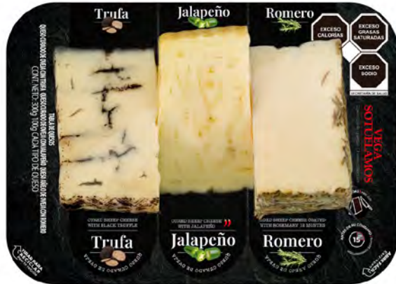
Trufa - Jalapeño - Romero