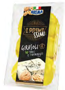
Nuez y Queso Cont. Net.: 250g / 500g