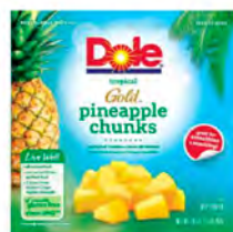
Piña gold Cont. Net.: 454g