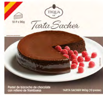
Tarta Sacher Cont. Net.: 880g