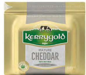
Cheddar Maduro / Curado Cont. Net.: 200g