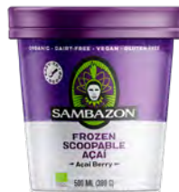
Açaí frozen scoopable Cont. Net.: 173g