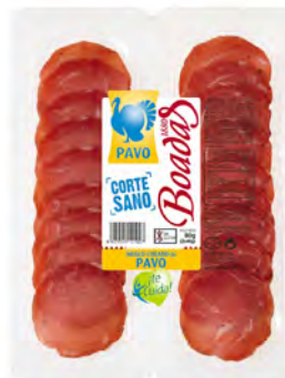
Muslo Curado de Pavo Cont. Net.: 80g (2x40g)