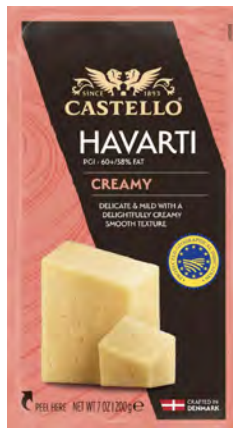
Creamy Havarti Cont. Net.: 200g