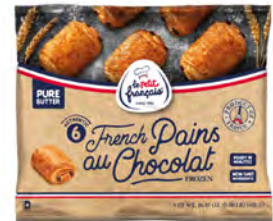
Masa para preparar chocolatinas Cont. Net.: 480g