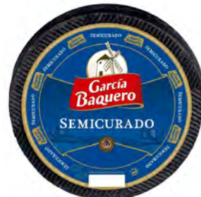
Semicurado Cont. Net.: 3 kg