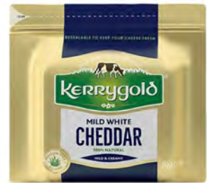
Cheddar Blanco Cont. Net.: 200g