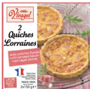
Quiche Lorraine Cont. Net.: 2x150g