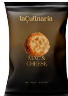
Mac & Cheese Cont. Net.: 1kg