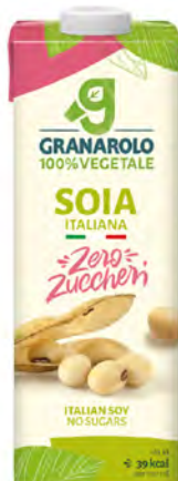
Soya Cont. Net.: 1L