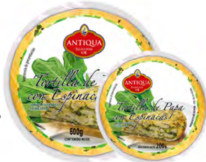
Tortilla Española con Espinaca Cont. Net.: 200g / 500g / 750g

200g RE0280 / 8420878598010 500g RE0097 / 8420878033542