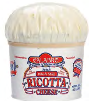
Ricotta Cont. Net.: 680g