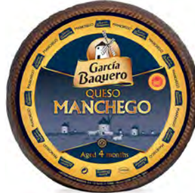
Manchego 4 Meses Cont. Net.: 3 kg