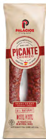
Chorizo Picante Cont. Net.: 225g