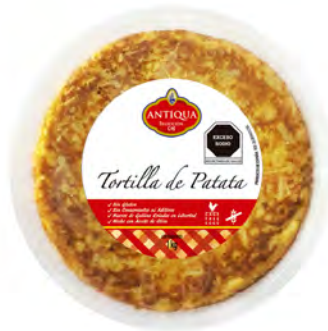
Tortilla Española con Cebolla Cont. Net.: 1kg