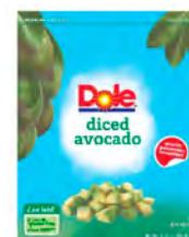
Arándanos en cubos Cont. Net.: 907g