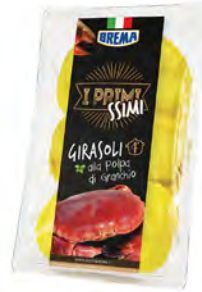
Cangrejo Cont. Net.: 250g / 500g