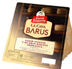
La Cava Barus Cont. Net.: 250g