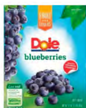
Arándanos Cont. Net.: 907g