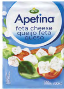
Queso Apetina Feta Bloque Cont. Net.: 200g