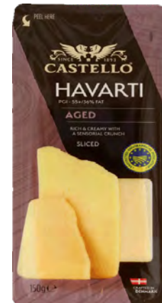
Aged Havarti Sliced Cont. Net.: 200g