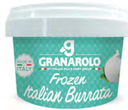
Burrata Cont. Net.: 100g