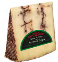
Aceituna Negra Curado Cont. Net.: Variable