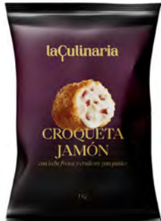
Jamón Cont. Net.: 1kg