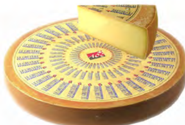
Bio 5 Meses Cont. Net.: Peso Variable