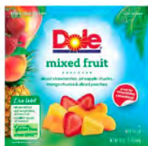
Mix de frutas (fresa, piña, mango y duraznos) Cont. Net.: 545g