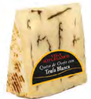
Trufa Blanca Cont. Net.: Variable