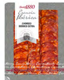
Chorizo Ibérico Extra Cont. Net.: 70g