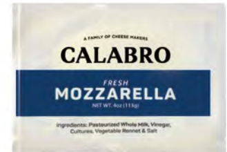
Mozzarella Flor de leche Cont. Net.: 454g