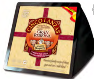
Cinco Lanzas Al Pedro Ximenez Cont. Net.: 250g