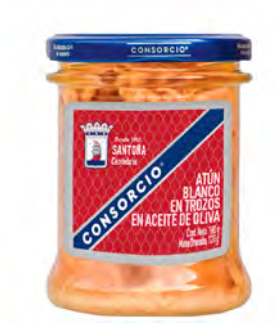
Atún Blanco en Aceite de Oliva