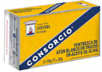
Ventresca de Bonito del Norte