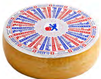
Appenzeller AOP 3 Meses Cont. Net.: Peso Variable