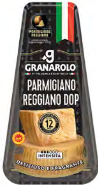
Parmigiano Reggiano DOP Cont. Net.: 150/200g