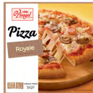
Jamón, queso y champiñones Cont. Net.: 320g