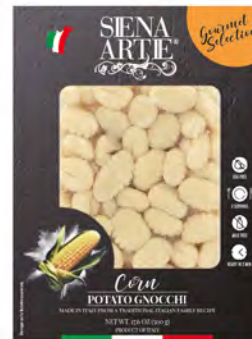
Patata con Maíz Cont. Net.: 500g