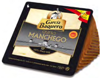
Manchego Semicurado Cont. Net.: 150g