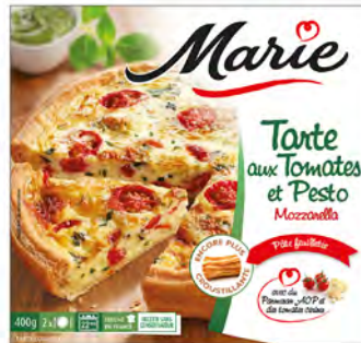
Tarta salada de jitomates y pesto Cont. Net.: 400g