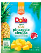
Piña gold Cont. Net.: 907g