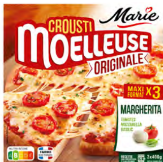
Margarita Cont. Net.: 3x400g