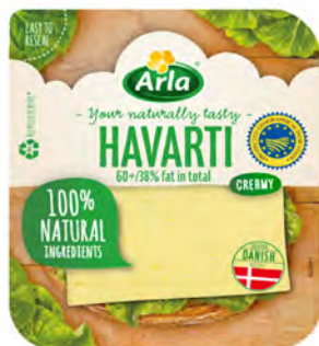
Lonchas Havarti Cont. Net.: 150g