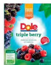
Arándanos, moras y frambuesas Cont. Net.: 907g