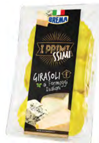
Quesos italianos Cont. Net.: 250g / 500g