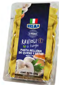
Queso y Setas Cont. Net.: 250g