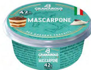
Mascarpone 42% Fat Cont. Net.: 250g (110 días)