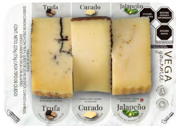
Trufa - Curado - Jalapeño