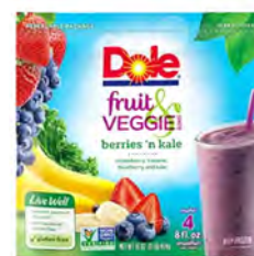
Bayas y kale Cont. Net.: 454g