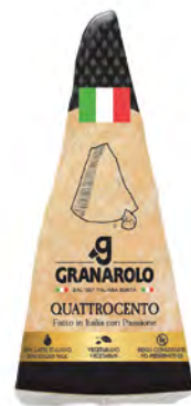
Quattrocento Cont. Net.: 300g