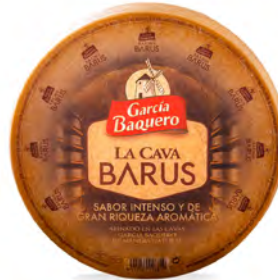
La Cava Barus Cont. Net.: 4 kg