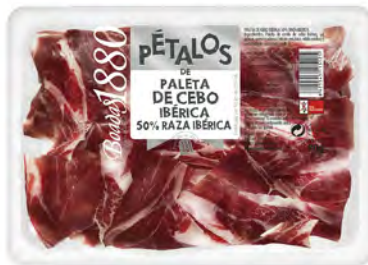
Paleta de Cebo Ibérica Cont. Net.: 80g