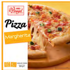
Margarita Cont. Net.: 320g