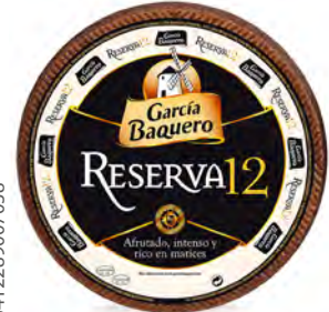
Reserva 12 Cont. Net.: 3 kg