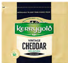
Cheddar Añejo Cont. Net.: 200g