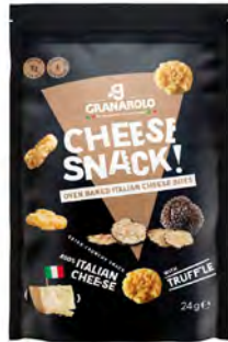
Trufa Cont. Net.: 24g/60g