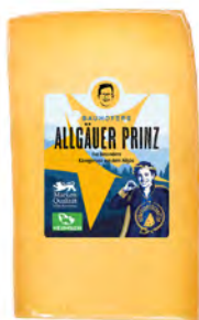
Prinz Cont. Net.: 200g