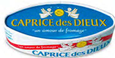
Caprice des Dieux Cont. Net.: 125g