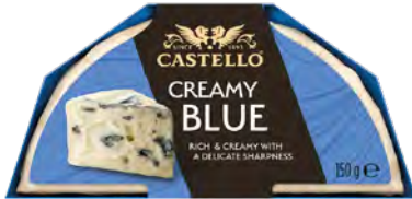
Creamy Blue Cont. Net.: 150g