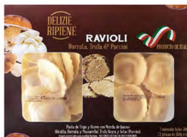
Burrata, Mozzarella, Trufa y Setas Cont. Net.: 700g