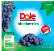
Arándanos Cont. Net.: 340g