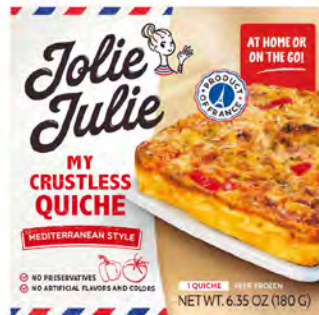
Estilo Mediterráneo Cont. Net.: 180g