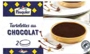
Tartaleta de Chocolate Cont. Net.: 200g 2 uds