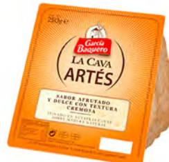
La Cava Artés Cont. Net.: 250g