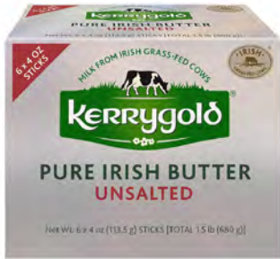
Mantequilla sin sal Cont. Net.: 680g (6 pzas de 113.5g c/u)