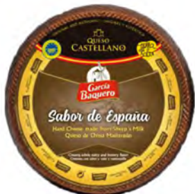
Oveja Castellana Cont. Net.: 3 kg