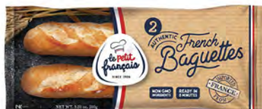
Masa para preparar baguettes Cont. Net.: 280g