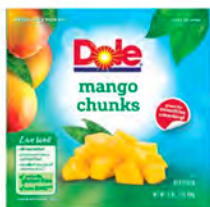
Mango Cont. Net.: 454g