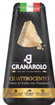
Quattrocento Cont. Net.: 150g