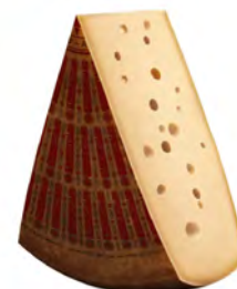
Emmentaler Cave Aged 15 - 20 Meses Cont. Net.: Peso Variable