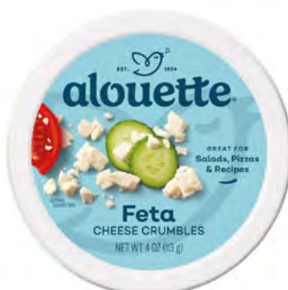
Queso Feta Cont. Net.: 99g