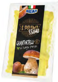
Grantortelli de trufa blanca Cont. Net.: 250g / 500g