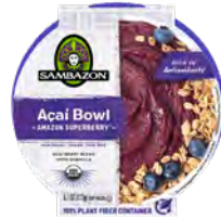
Açaí bowl amazon superberry Cont. Net.: 173g