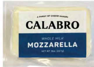
Mozzarella leche entera Cont. Net.: 227g