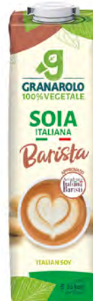
Soya Cont. Net.: 1L