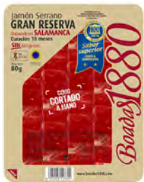
Jamón Serrano Gran Reserva Cont. Net.: 80g