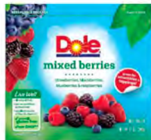
Mix berries (fresa, arándanos y frambuesas) Cont. Net.: 397g