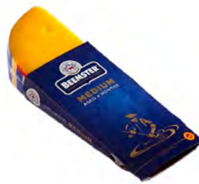
Medium 4 meses de maduración Cont. Net.: 150g