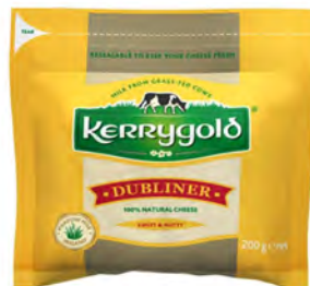
Queso Dubliner Cont. Net.: 200g