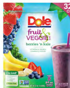
Bayas y kale Cont. Net.: 907g