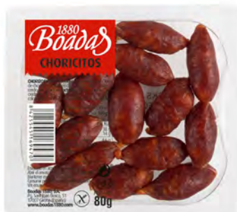
Choricitos Cont. Net.: 80g