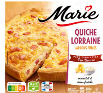
Quiche Lorraine tocino, huevos y queso Cont. Net.: 400g