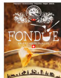
Fondue Cont. Net.: 400g