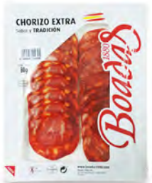
Chorizo Extra Cont. Net.: 80g