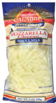
Mozzarella rallada leche entera Cont. Net.: 227g