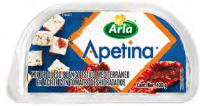
Mix de Feta con Tomates Deshidratados Cont. Net.: 100g