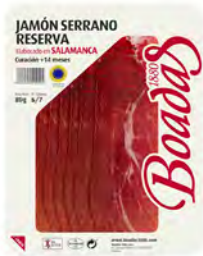
Jamón Serrano Reserva Cont. Net.: 80g