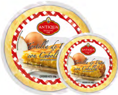
Tortilla Española con Cebolla Cont. Net.: 200g / 500g

200g RE0278 / 8420878597983 500g RE0096 / 8420878033535