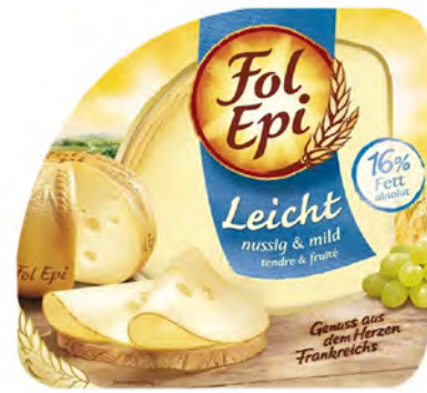
Allégé Rebanadas Cont. Net.: 150g