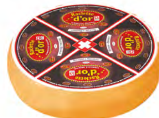
Raclette 6 Meses Cont. Net.: Peso Variable