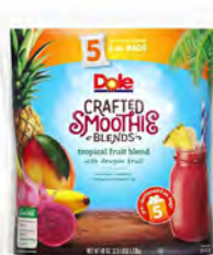
Piña, platano, mango y pitahaya Cont. Net.: 5 bolsas (226g)