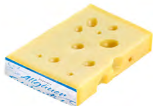
Emmentaler Cont. Net.: 250g