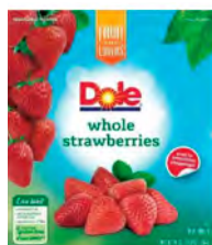
Fresas Cont. Net.: 1.4 kg