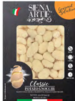
Patata Cont. Net.: 500g