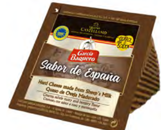
Oveja Castellana Cont. Net.: 150g