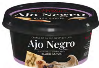
Ajo Negro Cont. Net.: 125g