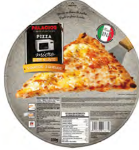
3 Quesos para microondas Cont. Net.: 350g