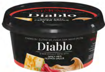
Diablo Cont. Net.: 125g