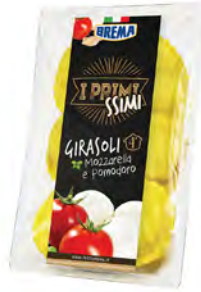
Tomate y Mozzarella Cont. Net.: 250g / 500g