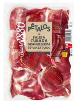
Paleta Curada Gran Reserva Cont. Net.: 80g