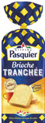
Pan Brioche Rebanado Cont. Net.: 450g