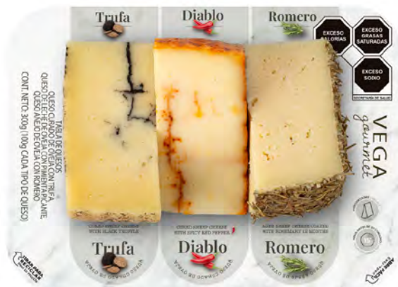
Trufa - Diablo - Romero