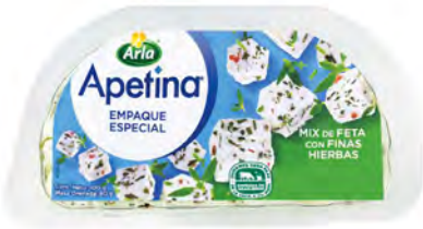
Mix de Feta con finas hierbas Cont. Net.: 100g