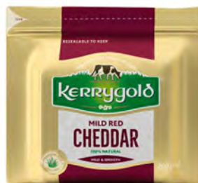
Cheddar Rojo Cont. Net.: 200g