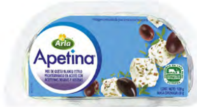
Mix de Feta con aceitunas negras y hierbas Cont. Net.: 100g