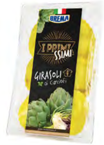
Alcachofa Cont. Net.: 250g / 500g