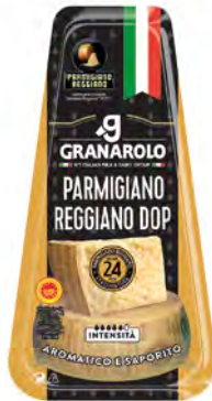
Parmigiano Reggiano DOP 24M Cont. Net.: 150g