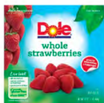
Fresas Cont. Net.: 454g