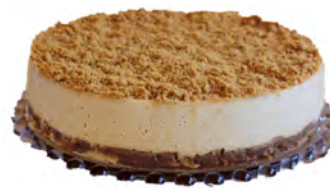
Speculoos Cheesecake Cont. Net.: 350g