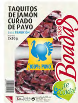
Muslo Curado de Pavo Cont. Net.: 200g (2x50g)