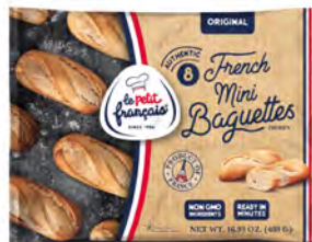
Mini baguettes Cont. Net.: 480g