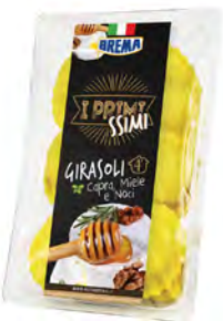
Miel, queso de cabra y nueces Cont. Net.: 250g / 500g