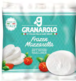
Mozzarella Cont. Net.: 125g