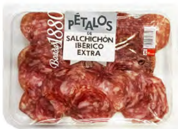
Salchichón Ibérico Extra Cont. Net.: 80g