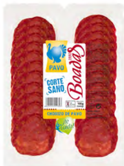
Chorizo de Pavo Cont. Net.: 100g (2x50g)