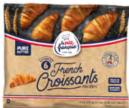
Masa para preparar croissants Cont. Net.: 390g