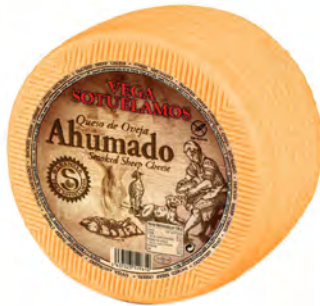
Ahumado Cont. Net.: Variable