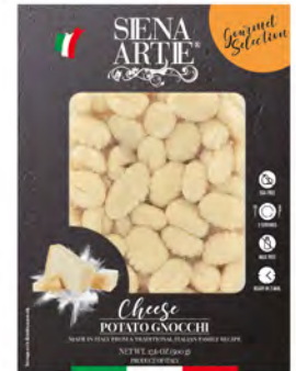
Patata con Queso Cont. Net.: 500g