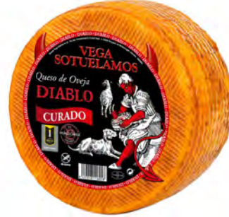
Diablo Curado Cont. Net.: Variable