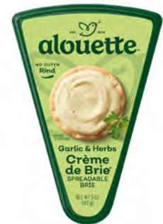
Crema Brie Ajo y Hierbas Cont. Net.: 142g