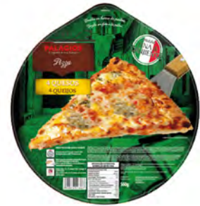
Mini Pizza 4 Quesos Cont. Net.: 225g