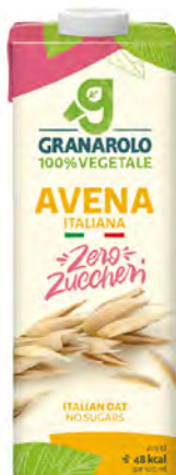
Avena Cont. Net.: 1L