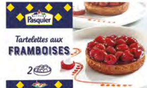
Tartaleta de Frambuesa Cont. Net.: 200g 2 uds