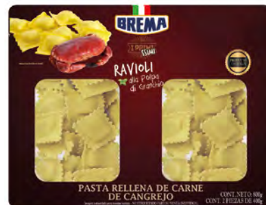
Carne de Cangrejo Cont. Net.: 800g