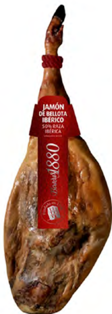
Jamón de Bellota Ibérico Cont. Net.: Peso Variable