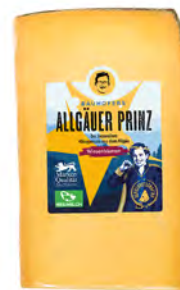
Flor de Heno Cont. Net.: 200g