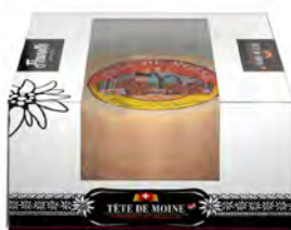
Tête de Moine Cont. Net.: 400g