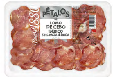
Lomo de Cebo Ibérico Cont. Net.: 80g