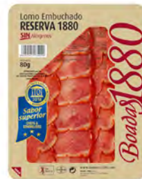
Lomo Embuchado Reserva Cont. Net.: 80g