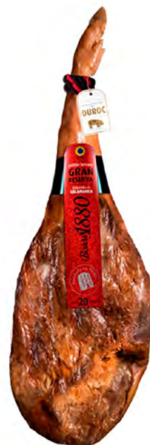
Jamón Serrano Gran Reserva Cont. Net.: Peso Variable