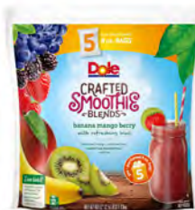
Platano, mango, fresa, arándanos, moras, kiwi y limón Cont. Net.: 5 bolsas (226g)