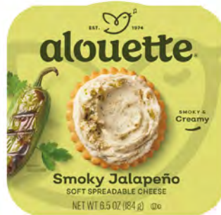
Jalapeño Ahumado Cont. Net.: 184g