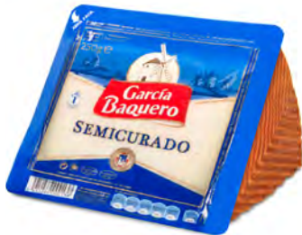
Ibérico Semicurado Cont. Net.: 150g / 250g