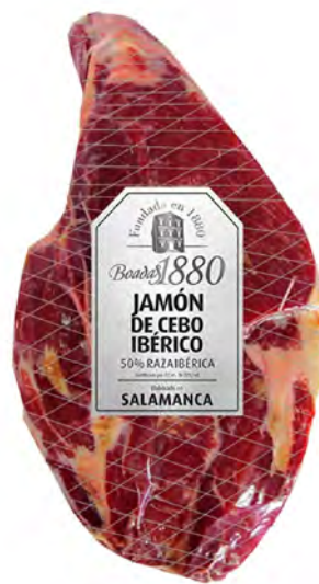
Jamón de Cebo Ibérico Cont. Net.: Peso Variable