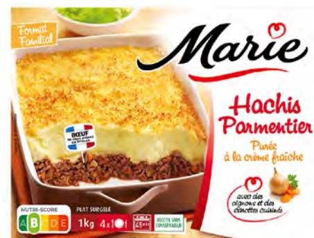
Pastel de Papa Gratinado Cont. Net.: 300g / 600g / 1 kg