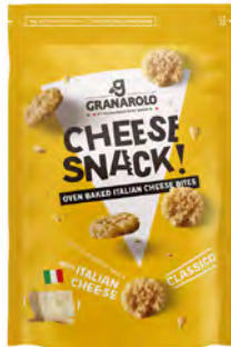
Clásico Cont. Net.: 24g/60g