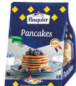
Pancakes Cont. Net.: 8 uds / 270g