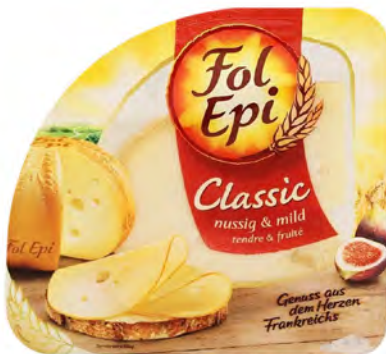
Classic Rebanadas Cont. Net.: 150g