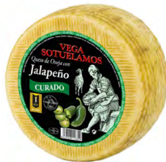
Jalapeño Curado Cont. Net.: Variable