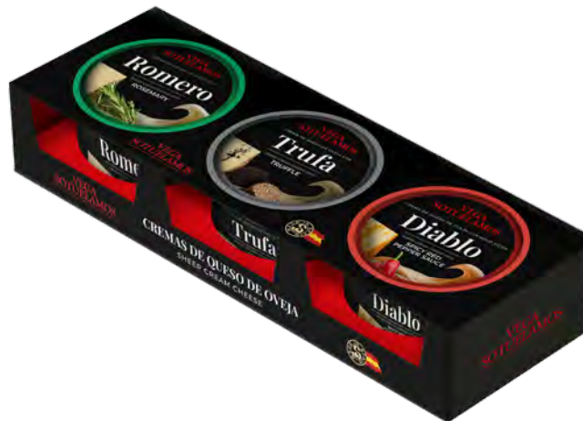
Tripack de Cremas Cont. Net.: Variable