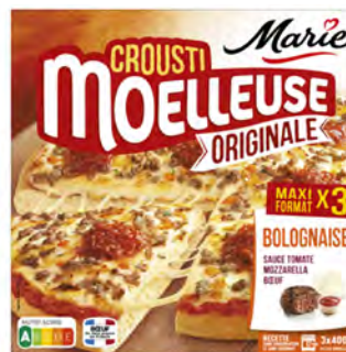
Boloñesa Cont. Net.: 3x400g