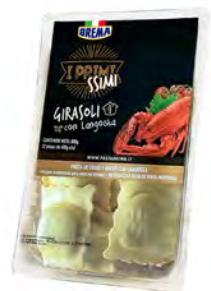
Langosta Cont. Net.: 250g / 500g