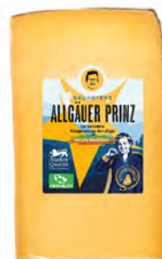
Prinz con Especies Cont. Net.: 200g