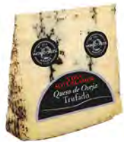
Trufado Curado Cont. Net.: Variable