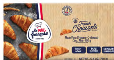
Masa para preparar croissants Cont. Net.: 780g