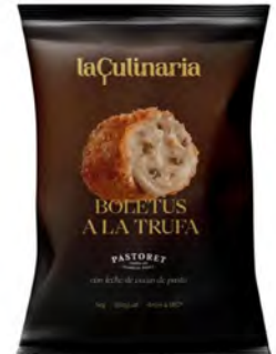
Boletus a la Trufa Cont. Net.: 1kg