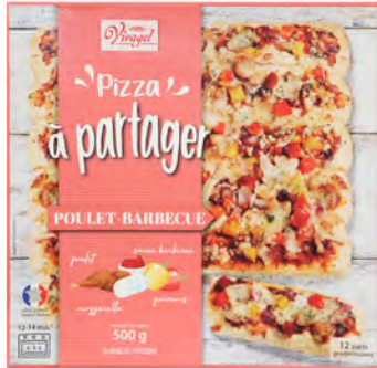
Pollo BBQ Cont. Net.: 500g