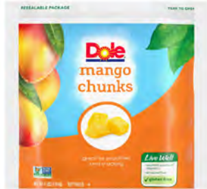
Mango Cont. Net.: 1.8 kg