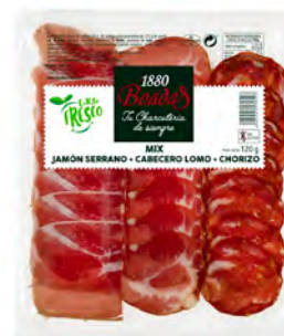
Mix Jamón Serrano + + Cabeza Lomo + Chorizo Cont. Net.: 120g / 300g