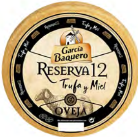
Reserva 12 Trufa y Miel Cont. Net.: 3 kg