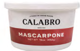
Mascarpone Cont. Net.: 450g