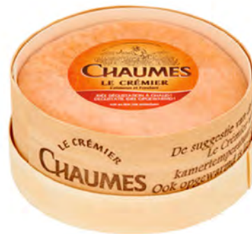
Chaumes Cremoso Cont. Net.: 250g