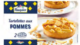
Tartaleta de Manzanas Cont. Net.: 200g 2 uds