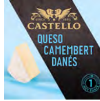
Queso Camembert Cont. Net.: 125g