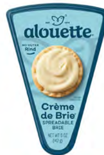
Crema Brie Cont. Net.: 142g