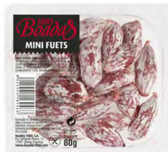
Mini Fuets Cont. Net.: 80g