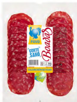
Salchichón de Pavo Cont. Net.: 100g (2x50g)