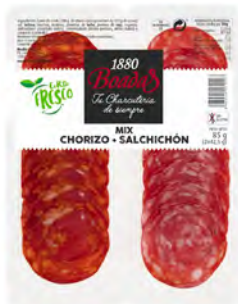
Mix Chorizo + Salchichón Cont. Net.: 85g