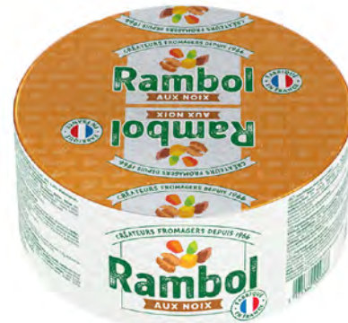
Rambol Cont. Net.: 2 kg