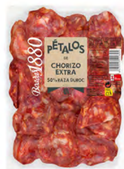
Chorizo Ibérico Extra Cont. Net.: 80g