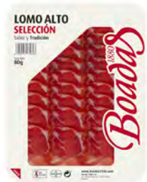
Lomo Alto Cont. Net.: 80g