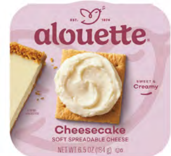
Cheesecake Cont. Net.: 184g