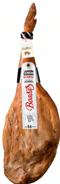
Jamón Serrano Reserva Cont. Net.: Peso Variable