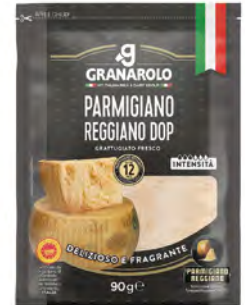
Parmigiano Reggiano DOP Cont. Net.: 90g