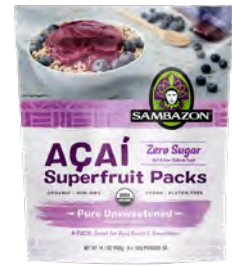
Açaí super fruit packs zero azúcar Cont. Net.: 400g