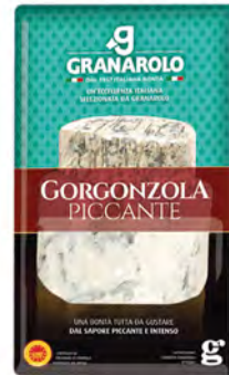
Picante Dop Cont. Net.: 200g