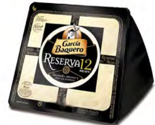
Reserva 12 Meses Cont. Net.: 200g