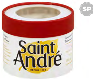
Saint André Cont. Net.: 200g