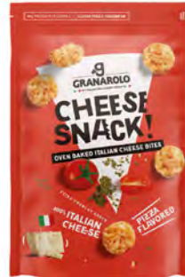
Pizza Cont. Net.: 24g/60g