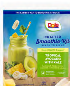
Mezcla de frutas tropicales con khale Cont. Net.: 790g