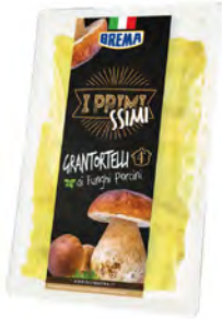
Setas Cont. Net.: 250g / 500g