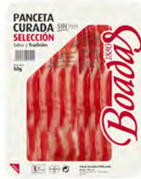
Panceta Curada Cont. Net.: 80g