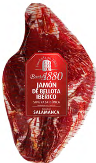
Jamón de Bellota Ibérico Cont. Net.: Peso Variable