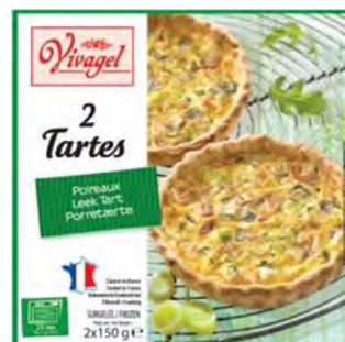
Tarta Salada de Porros Cont. Net.: 2x150g