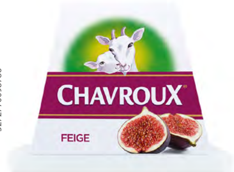
Chavroux con Higo Cont. Net.: 150g