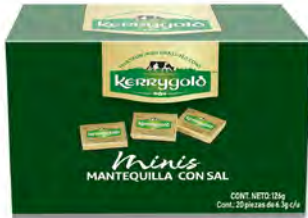
Mantequilla mini con sal Cont. Net.: 126g (20 pzas de 6.3 c/u)