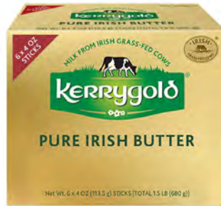
Mantequilla con sal Cont. Net.: 680g (6 pzas de 113.5g c/u)