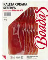
Paleta Curada Reserva Cont. Net.: 80g