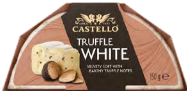
Truffle White Cont. Net.: 150g