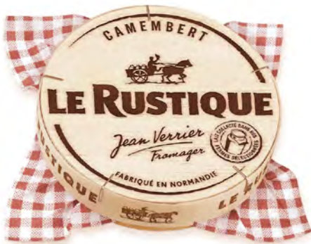
Camembert Cont. Net.: 250g