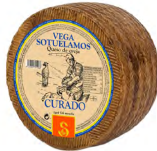
Curado Cont. Net.: Variable