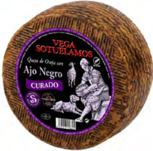
Ajo Negro Curado Cont. Net.: Variable