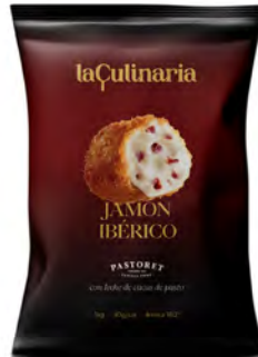
Jamón Ibérico Cont. Net.: 1kg