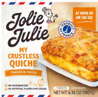
Queso y Cebolla Cont. Net.: 180g