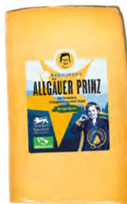
Hierbas del Monte Cont. Net.: 200g