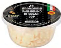
Parmigiano Reggiano DOP Cont. Net.: 80g