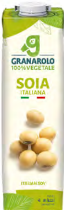
Soya Cont. Net.: 1L