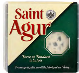
Porción Saint Agur Cont. Net.: 125g