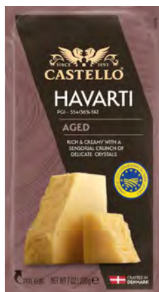
Aged Havarti Block Cont. Net.: 200g