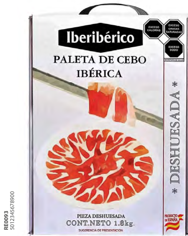
Paleta de Cebo Ibérica Jabugo Cont. Net.: 1.8 kg

Marca referente en el mercado europeo de productos cárnicos de cerdo ibérico de la más alta calidad en IBERIBÉRICO siguen elaborando de forma artesanal sus productos. Situado en el famoso pueblo de Jabugo, al sur de España, siguen los patrones de maduración que se han transmitido de generación en generación para la elaboración de productos ibéricos mimando con esmero, el proceso de producción y curado de jamones, paletas y embutidos ibéricos.