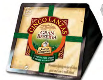
Cinco Lanzas Al Romero Cont. Net.: 200g