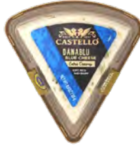
Queso Azul Extra Cremoso Cont. Net.: 100g