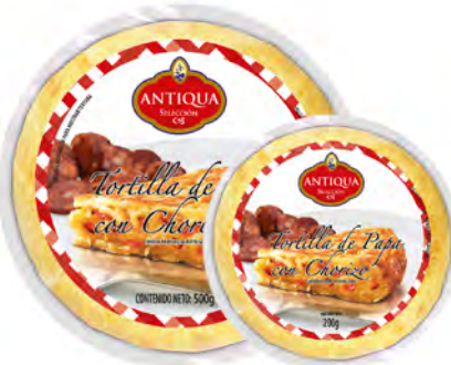
Tortilla Española con Chorizo Cont. Net.: 200g / 500g / 750g

200g RE0280 / 8420878598010 500g RE0097 / 8420878033542