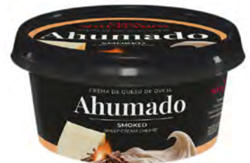
Ahumado Cont. Net.: 125g