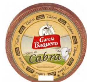
Cabra Cont. Net.: 3 kg