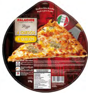
4 Quesos para horno Cont. Net.: 360g