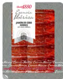
Jamón Ibérico de Cebo Cont. Net.: 70g