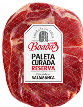
Paleta Curada Reserva Cont. Net.: Peso Variable