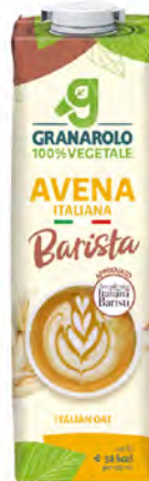
Avena Cont. Net.: 1L