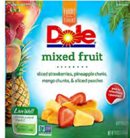
Mix de frutas (fresa, piña, mango y duraznos) Cont. Net.: 1.8 kg