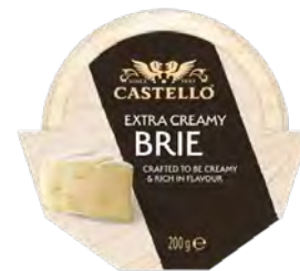
Extra Creamy Brie Cont. Net.: 200g