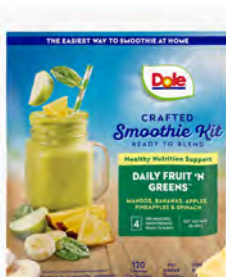
Mezcla de frutas verdes Cont. Net.: 790g