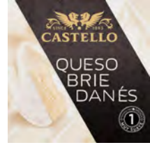
Queso Brie Cont. Net.: 125g