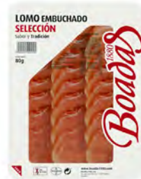
Lomo Embuchado Cont. Net.: 80g