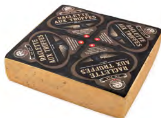
Raclette Truffes Spicy 5 Meses Cont. Net.: Peso Variable