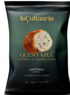
Queso Azul y Cebolla Caramelizada Cont. Net.: 1kg