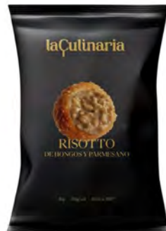
Risotto Hongos y Parmesano Cont. Net.: 1kg