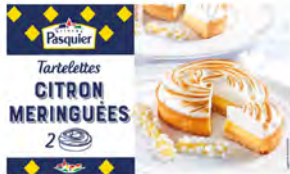
Tartaleta Merengue de Limón Cont. Net.: 200g 2 uds