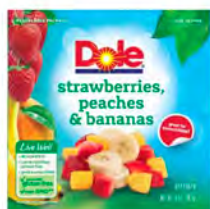
Fresa, durazno y plátano Cont. Net.: 397g